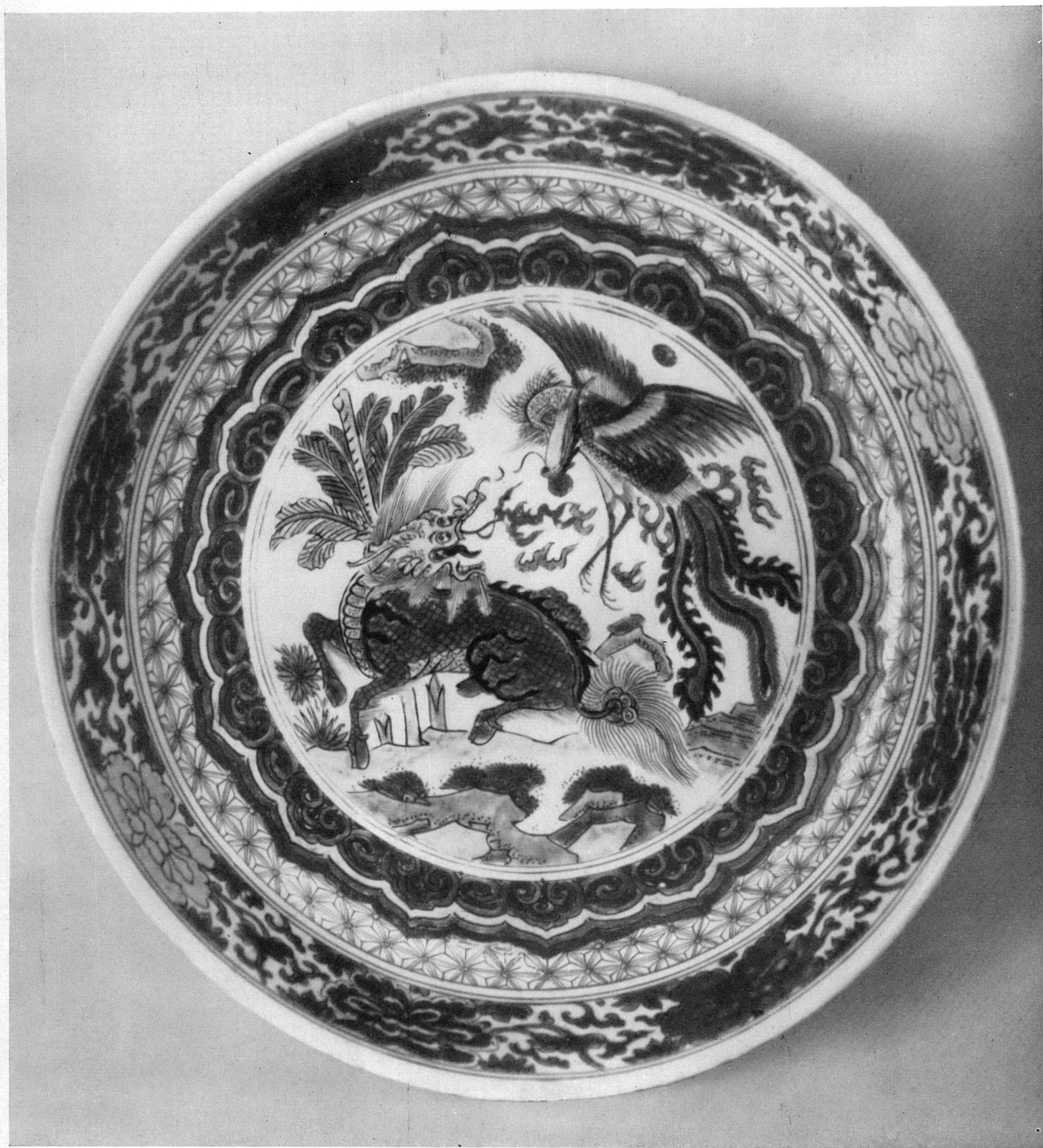
PL. II. — Chine. Plat en couleurs émaillées, époque Ming. — Genève, Musée Ariana.