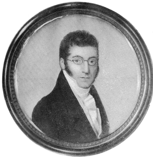
Pl. XVII. — J. DuBois. La Mer de Glace vue du Montenvers, aquatinte gravée par Himely. — J. DuBois en 1820, miniature. A M me C. Constantin-Chaix.