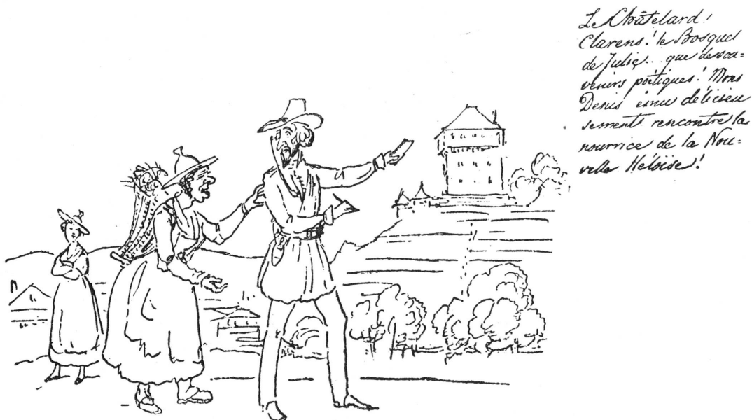
FIG. 1. — Caricature de J. DuBois extraite du « Papillon » 1 .

Jean DuBois a pris soin de noter cet aspect inattendu, ridicule ou mesquin dans une série de savoureux dessins à la plume. Il s'agit de « La Suisse en 1840, déceptions et mésaventures d'un voyage de plaisir. Dessins par feu Jean DuBois, Membre de la Société des Arts de Genève. Texte par DuBois-Melly ». Paru dans la revue comique genevoise « Le Papillon » de 1889 à 1890.