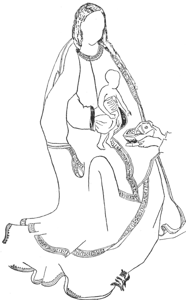
FIG. 2. — Retable de Fribourg. Epiphanie.

Galon au bas de la robe de saint Jean. Inscription en caractères spéciaux (fig. 4; pl. XI).