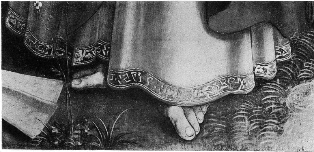
Pl. XI. — En haut: Miniature de Boccace, deuxième moitié du XV e s., Genève, Bibl. Publique et Universitaire, Détail. — En bas: Fribourg, Eglise des Cordeliers, retable du Maître à l'oeillet, détail.