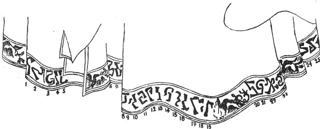
FIG. 4. — Retable de Fribourg. Crucifixion. Bas de la robe de Saint Jean.

REGINA: Regina. Nativité, galon du bas. — FENTRIS: Ventris. Ibid. — NOSTRAS: Nostra. Ibid. — DEFGORIA: Def. Gloria. Ibid., galon du haut. — EFE: