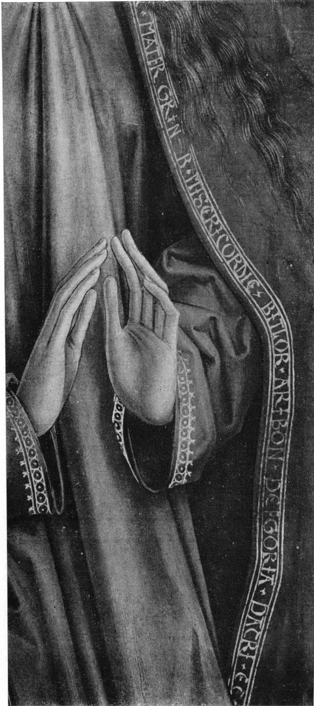
Pl. X. — Fribourg, Eglise des Cordeliers, retable du Maître à l'écillet, détail.