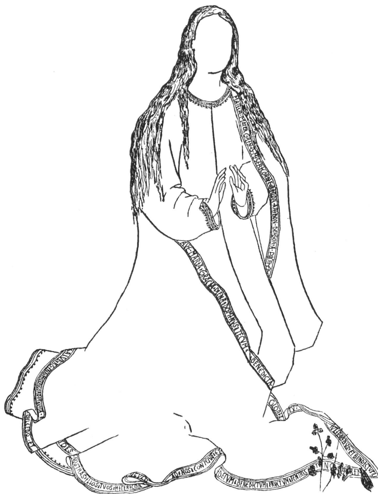
FIG. 1. — Retable de Fribourg. Nativité.

A. Nativité. Manteau de la Vierge ( fig. 1 ).