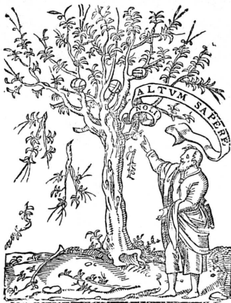
FIG. 327. Marque des Estienne.

ETTE enquête nous a amenés jusqu'à la fin du XVIII e siècle; encore en avons-nous négligé les dernières années et omis en général les noms des artistes et des artisans qui, nés à ce moment, appartiennent par leur activité au XIX e siècle. La Révolution, puis l'annexion à la France rompent avec le passé local et préparent le XIX e siècle. La Restauration genevoise de 1814 pourra en apparence renouer la tradition, elle n'empêchera pas l'esprit nouveau de se manifester dans toutes les formes sociales, dans celles des arts et des industries. Certaines activités, jadis florissantes, déclinent et même disparaissent, d'autres surgissent ou se développent. Une période est close, une autre va s'ouvrir.