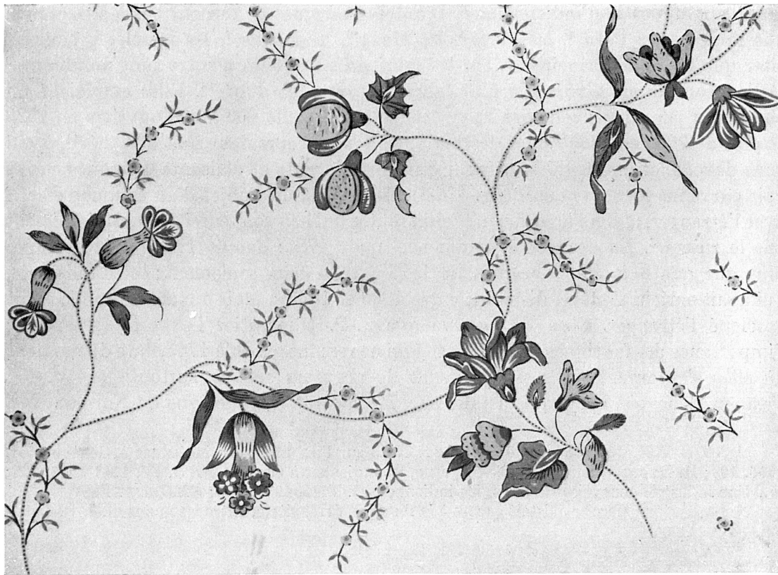
FIG. 326. — Indienne, XVIII e siècle. Dessin de meuble.

La draperie 1 , ancienne à Genève, y est active au XVI e siècle et bénéficie de l'expérience des réfugiés français 2 ; elle l'est encore jusque vers le milieu du XVII e . Les faiseurs de draps ont leurs ateliers à Saint-Jean et dans l'île du Rhône, et l'un des ponts qui y conduit s'appelle le pont « des Frises » à cause d'un bâtiment pour