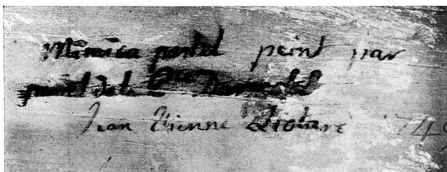
FIG. 288. — J.-E. Liotard. Portrait de la comtesse de Coventry, et inscription au dos du pastel. Musée de Genève. Dépôt de la Fondation Gottfried Keller.