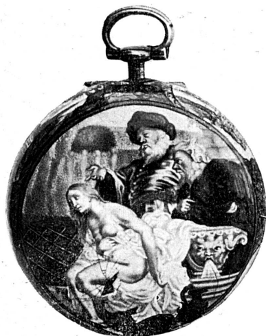
FIG. 278. — Montre du XVII e siècle, Ecole des Huaud. Décor extérieur. Musée de Genève.

Ses trois fils sont ses élèves et travaillent sans doute avec lui jusqu'à sa mort 2 . Pierre II , l'aîné, né à Genève en 1647, fait en 1685 un premier séjour à la cour de l'Electeur de Brandebourg, revient à Genève en 1686, repart en 1689 pour l'Allemagne où il est nommé peintre de l'Electeur en 1691; il y meurt après 1696 et avant 1698 3 . Le plus habile, mais aussi le moins connu des trois frères, il signe ses œuvres — la plus ancienne pièce datée est de 1679 4 — « Pierre Huaud l'aisné » ou en latin « Petrus Huaud major natus », comme on le voit sur deux montres 5 et un portrait de 1688 6 qu'il a faits à Genève et qui sont conservés dans le musée de cette ville (fig. 276, 279).