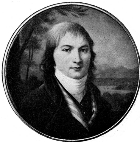
FIG. 284. Portrait d'inconnu, par J.-F. Soiron, 1799. Musée de Genève.