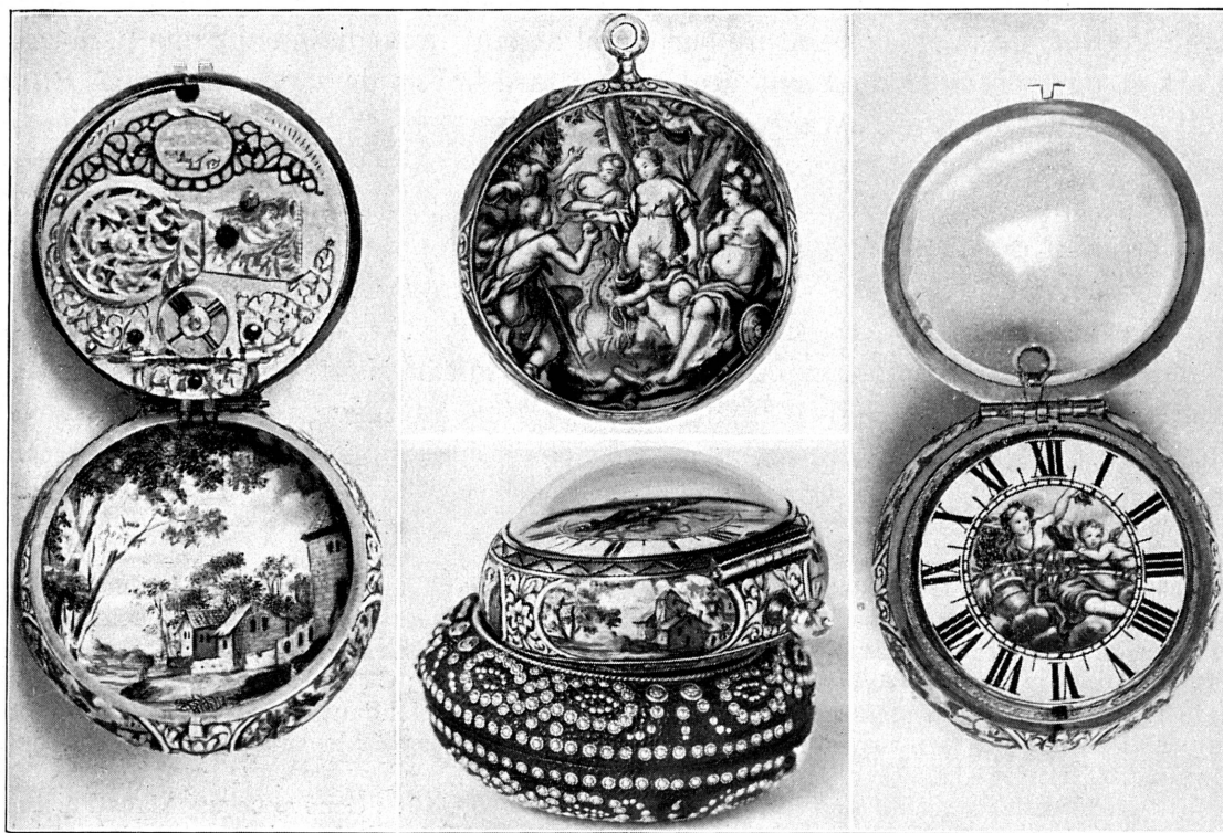
FIG. 276. — Montre signée « Huaud l'ainé », fin du XVII e siècle. Musée de Genève.

Son fils, Jean II Petitot , né en 1653, travaille à Paris dans l'atelier de son père dont il a embrassé la carrière, puis en Angleterre, se réinstalle à Paris et meurt en 1702 dans son château de Maison Seule, à La Queue-en-Brie 2 . La réputation du père a porté préjudice à celle du fils dont le talent, toutefois, à en juger par les portraits connus, n'est pas négligeable. « A la pointe de ce pinceau dont certains ont nié la finesse, dit M. Dufaux, il s'est gagné finalement un château... Qu'un portraitiste en émail puisse acquérir un domaine, la chose vaut d'être marquée. La réputation de Petitot fils ne peut qu'y gagner. »