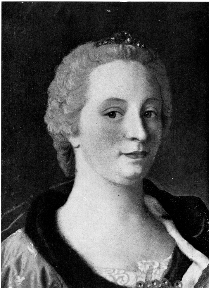
FIG. 280. — Portrait de Marie-Thérèse d'Autriche, par J.-E. Liotard. Musée de Genève.