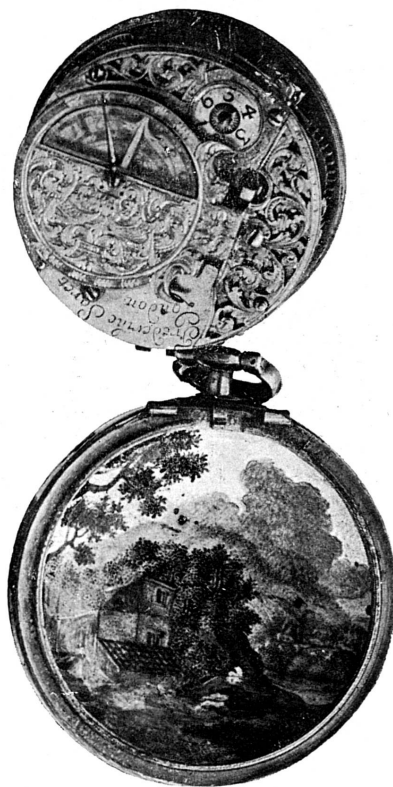
FIG. 277. — Montre du XVII e siècle, Ecole des Huau. Décor intérieur. Musée de Genève.

Fils d'un orfèvre poitevin, Pierre I Huau naît à Châtellerauld vers 1612 et vient à Genève en 1630 à l'âge de dix-huit ans. Apprenti de l'orfèvre Laurent Légaré, il est reçu maître-orfèvre et bourgeois en 1671, et meurt en 1680 7 . Il se spécialise sans doute dans la peinture sur émail — peut-être a-t-il passé par Blois 8 —, mais on