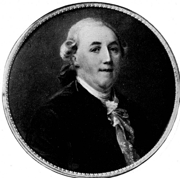
FIG. 282. — Portrait de J. Necker, par Jacques Thouron. Musée de Genève.