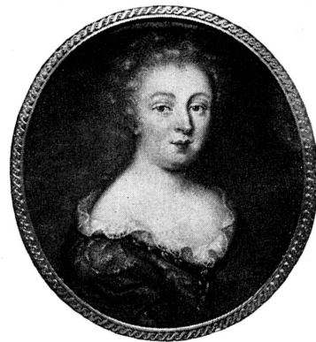
FIG. 279. Portrait, par Pierre II Huaud, 1688. Musée de Genève.