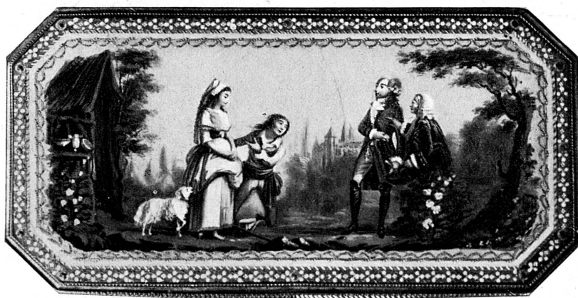
FIG. 285. — Tabatière, émail genevois, XVIII e siècle. Musée de Genève.