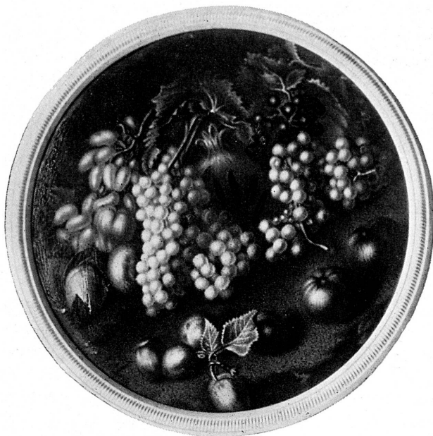
FIG. 281. — Nature morte, par Al. de la Chana. Musée de Genève.

Le XVIII e siècle est une « époque admirable pour l'industrie genevoise » 2 et pour la peinture sur émail, autant par la qualité de quelques-uns de ses repré-