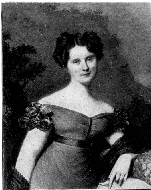
FIG. 270. — L.-A. Arlaud-Jurine. Miniature, portrait de la princesse Löwenstein, d'après Massot. Musée de Genève.

Accordons une rapide mention à une pratique qui fut très en vogue au XVIII e et au début du XIX e siècle, divertissement de virtuose plus que recherche artistique, celle de la découpe en silhouettes 7 . Des peintres genevois, et