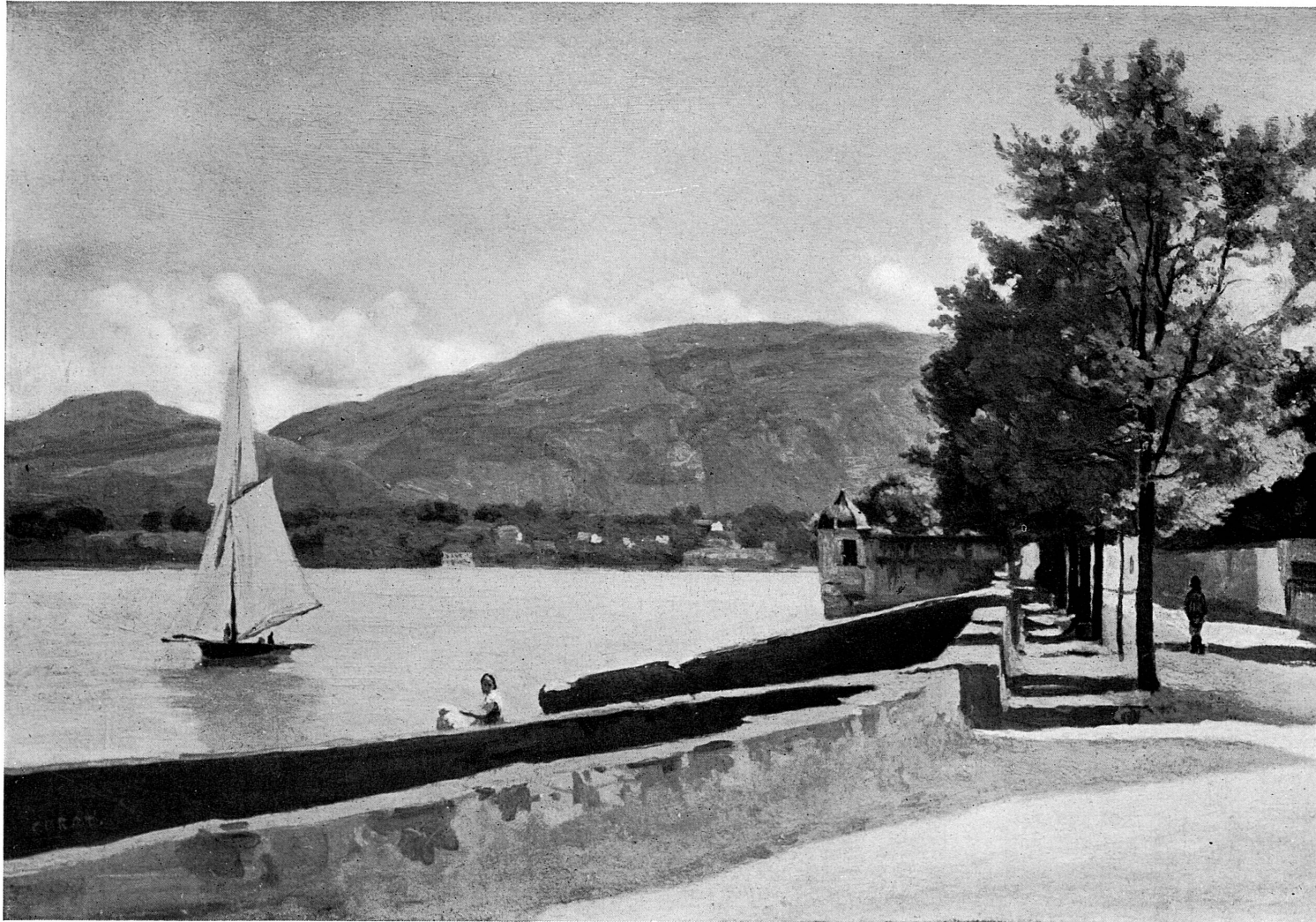
FIG. 273. — Genève, le quai des Pâquis, par C. J. B. Corot (1796-1875). Musée de Genève.