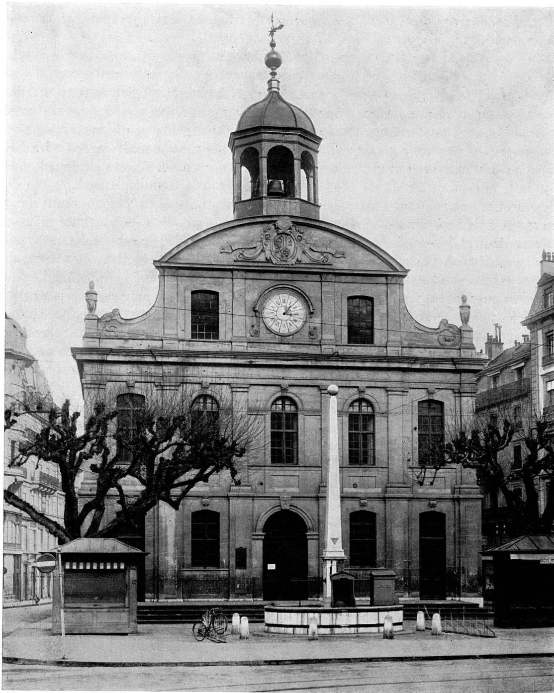
FIG. 207. — Le temple de la Fusterie