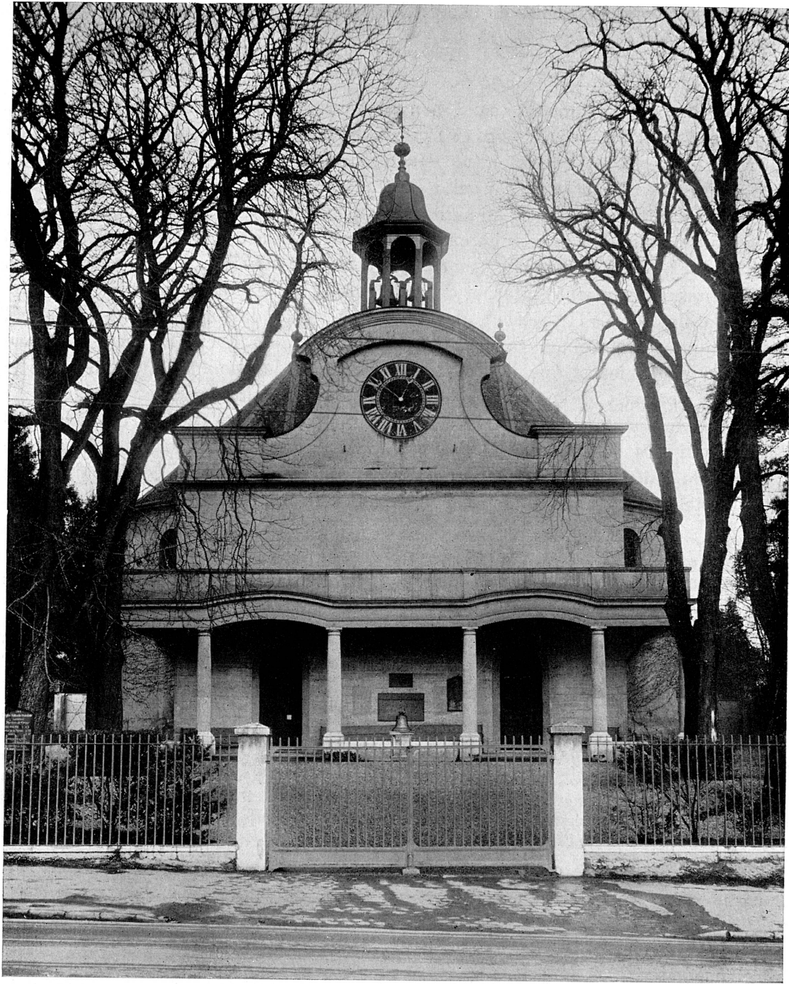
FIG. 208. Le temple de Chêne-Bougeries.