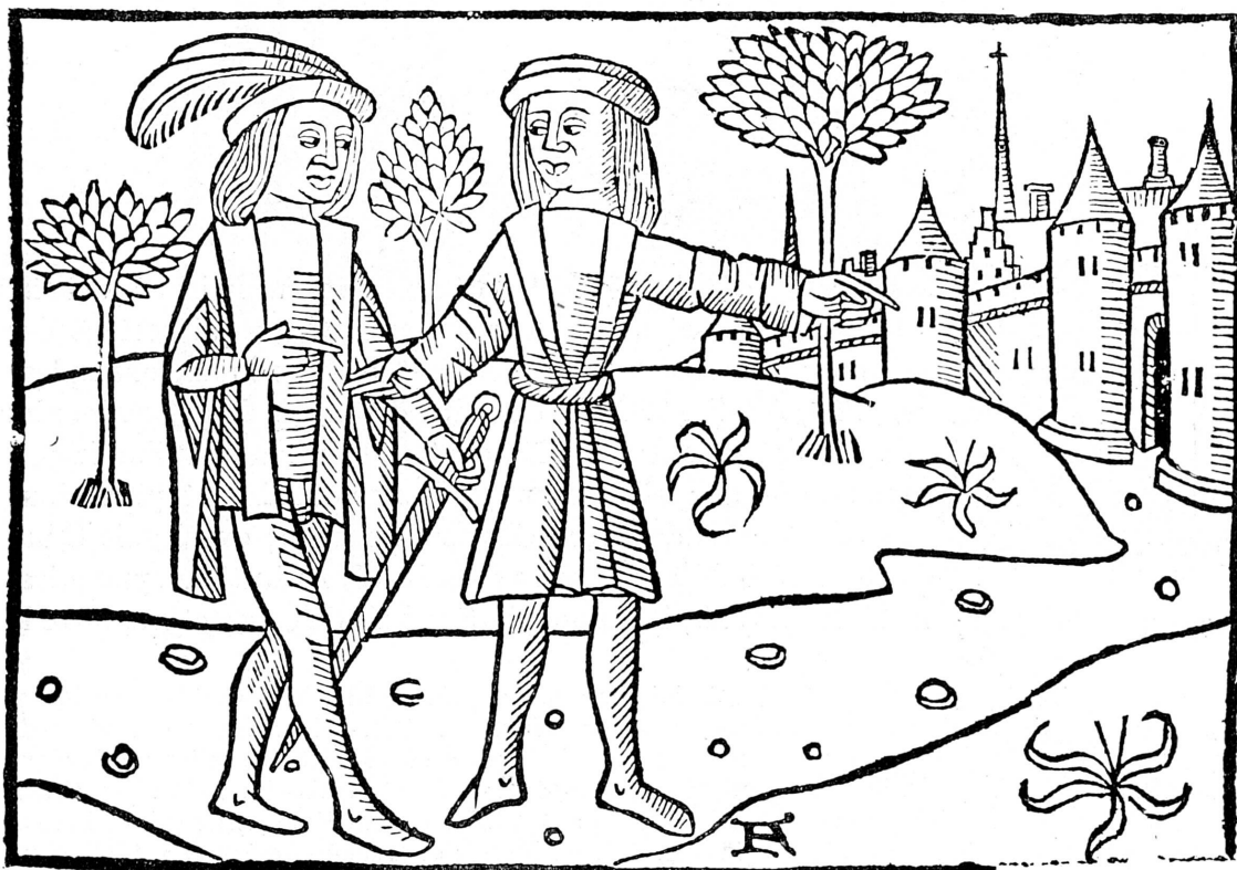
FIG. 190. — « Histoire d'Olivier de Castille », Louis Cruse, 2 me édition, vers 1492: Arrivée d'Artus à Londres.

marque qui se trouve au bas de la figure à droite 1 . Les imprimeurs se copient mutuellement leurs illustrations: celles du « Calendrier des Bergers », de Jean Belot, vers 1498-1500, sont empruntées au « Calendrier des Bergers » de Guy Marchant à Paris (1491, 1493, 1496, 1497, 1500); une autre reproduit la Grosse Margot qui illustre le « Grand Testament » de François Villon, imprimé à Paris par Pierre Levet en 1489 2 .