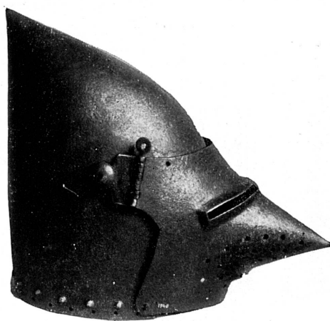
FIG. 175. — Bacinet provenant d'Avusy, XIV e -XV e siècle. Musée de Genève.