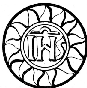
FIG. 106. Linteau de porte, Laconnex, canton de Genève, 1558.