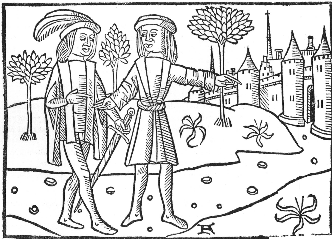
Fig. 2. — Olivier de Castille (f o f 2 v o ) : Arrivée d'Artus à Londres.

eure(n)t gra(n)des diverses et merveilleuses fortu(n)es... Or est ainsi q(ue) ap(rè)s q(ue) la dicte hystoire fut p(re)mier imprimée s'est trouvée incorrecte en aulcu(n)s lieux et imp(ar)faite et aussi q(ue) les intitulations des chapitres ne se(m)bloie(n)t pas par tout co(n)tenir le cas clèremment. Et pour ce q(ue) Maistre Loys Garbin cytoyen et i(m)primeur de Genesve a esté par aulcuns sollicité de l'imprimer, à la décoration de l'hystoire et visible délectation des liseurs et à la consolation des désirans : il a fait faire les hystoires devant les chapitres pour rendre la dicte hystoire plus fructueuse au plaisir de chascun. Et sans adjouster, oster ne diminuer, a fait faire les intitulations des chapitres selon la matière... »