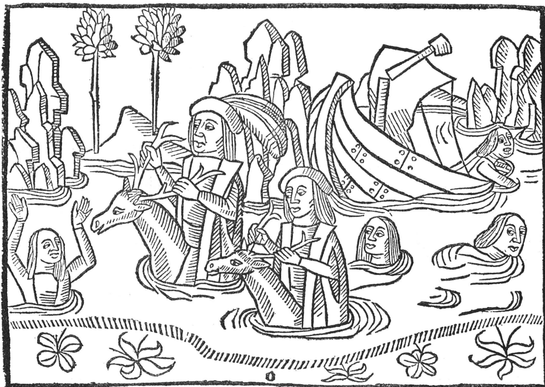
Fig. 1. — Olivier de Castille (f o b 5 v o ) : Olivier et son compagnon miraculeusement sauvés après une tempête.

Le FONDS AUXILIAIRE a fait don de divers ouvrages et a contribué à l'achat d'un incunable genevois, la deuxième édition de l' Histoire d'Olivier de Castille 1 , imprimée à Genève par Louis Garbin dit Cruse, vers 1492, et ornée de nombreuses gravures sur bois 2 . On ne connaît de cette édition que cinq ou six exemplaires, qui présentent presque tous des variantes et dont deux au moins sont incomplets. C'est un de ces deux derniers dont la Bibliothèque s'est rendue acquéreur ; il lui manque douze feuillets (sur 56) et huit gravures (sur 40).