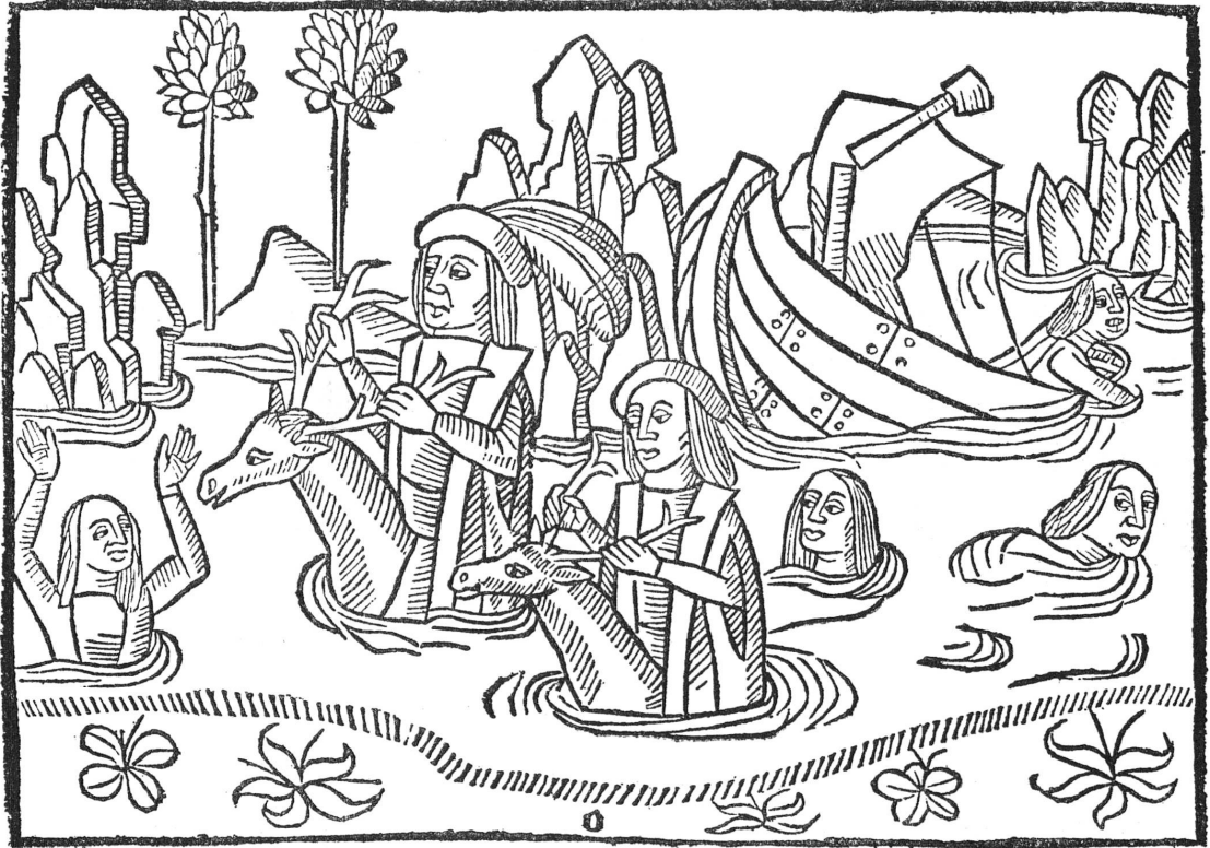
Fig. 1. — Olivier de Castille (f o b 5 v o ) : Olivier et son compagnon miraculeusement sauvés après une tempête.

Le FONDS AUXILIAIRE a fait don de divers ouvrages et a contribué à l'achat d'un incunable genevois, la deuxième édition de l' Histoire d'Olivier de Castille 1 , imprimée à Genève par Louis Garbin dit Cruse, vers 1492, et ornée de nombreuses gravures sur bois 2 . On ne connaît de cette édition que cinq ou six exemplaires, qui présentent presque tous des variantes et dont deux au moins sont incomplets. C'est un de ces deux derniers dont la Bibliothèque s'est rendue acquéreur ; il lui manque douze feuillets (sur 56) et huit gravures (sur 40).