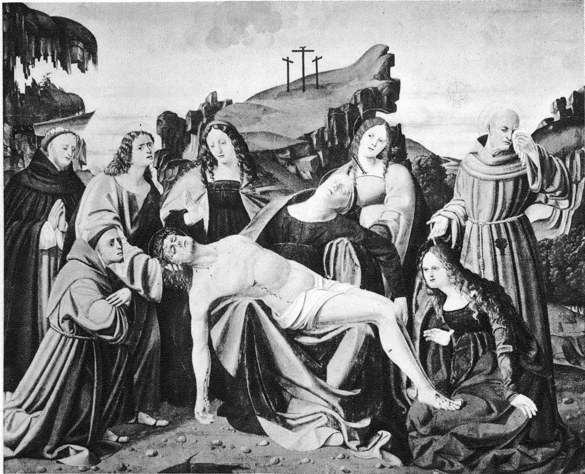
Pl. XI. — En haut. La Vestale Tuscia. Collection Lanckoronski, Vienne. — En bas. 1905-55. Pieta. Ecole lombarde. Musée de Genève.