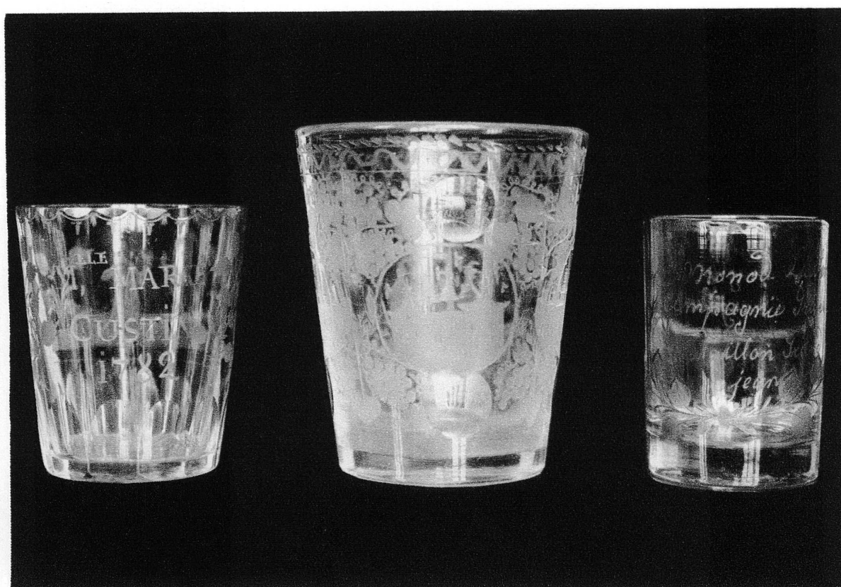
Pl. XXIII. — Verres gravés des fabriques du Doubs, Musée de Genève. — En haut : 13747, 13604. — En bas : 8156, 13450, 5917.