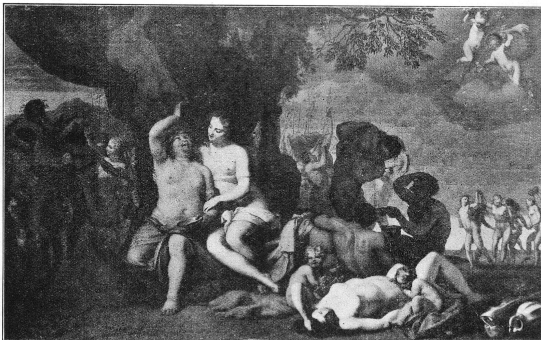
FIG. 1. — BARENT GRAAT. Bacchanale. (Avant la restauration).

1. Bacchus : apparition des jambes originales ; la peau de tigre revient sur le genou.