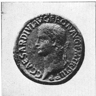
FIG. 2. Grand Bronze de 39 ap. J.C. Tête aurée de Caligula. (Cohen, I, p. 240, 25).

pour épouser sa maîtresse, Milonia Caesonia; c'était une dame romaine d'âge assez mûr, qui, trente jours après ses noces, mit au monde Julia Drusilla 1 . Quiconque a lu le portrait de cet empereur dans Suétone comprendra que les conséquences de ces divers événements matrimoniaux aient exaspéré les passions de ce débauché. Il