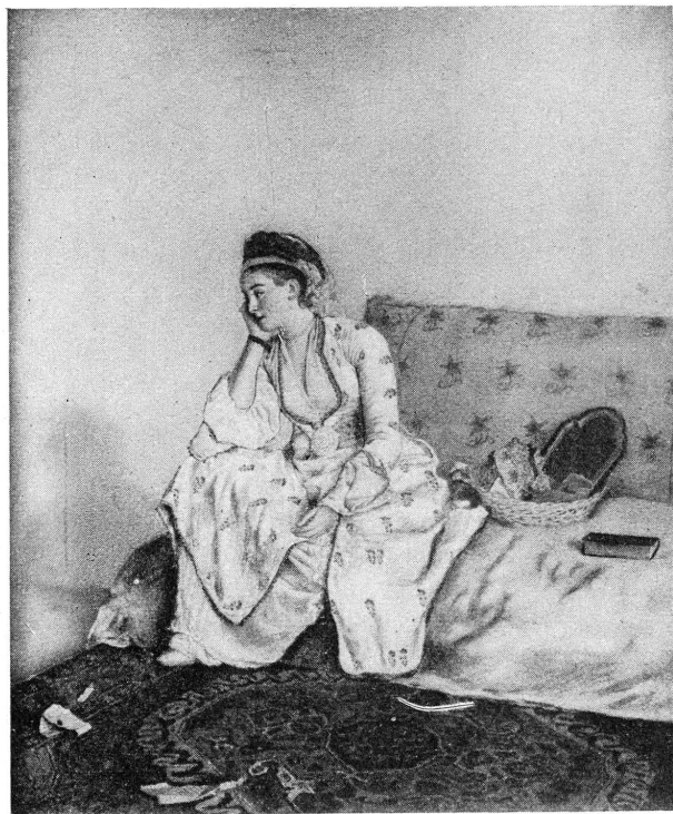
FIG. 1. — J. E. LIOTARD. Portrait de la comtesse de Coventry.

dimension (0.93 × 0.73, au pastel), le second dans la collection de lord Fitzhardinge, à Crawford, le troisième, à l'huile, dans la collection Fatio, à Genève. Les trois identifications pourraient être erronées.