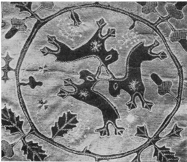
FIG. 3. — Tapis du XVIII e siècle. (Musée d'Art et d'Histoire, n° 5023.)