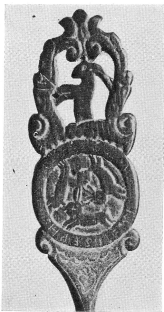
FIG. 4. — Cuiller du XVIII e siècle. (Musée d'Art et d'Histoire, n° 4637.)