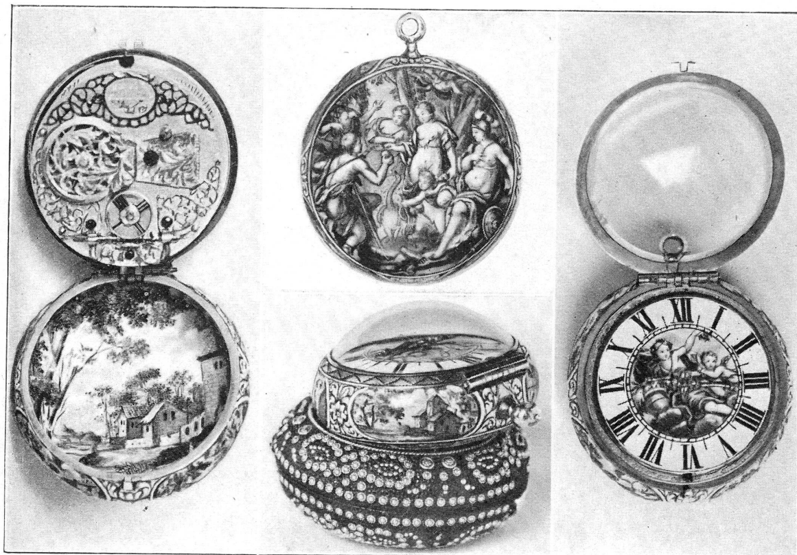
FIG. 2. — Montre signée « Huaud l'aîné », fin du XVII e siècle. Ecole genevoise.