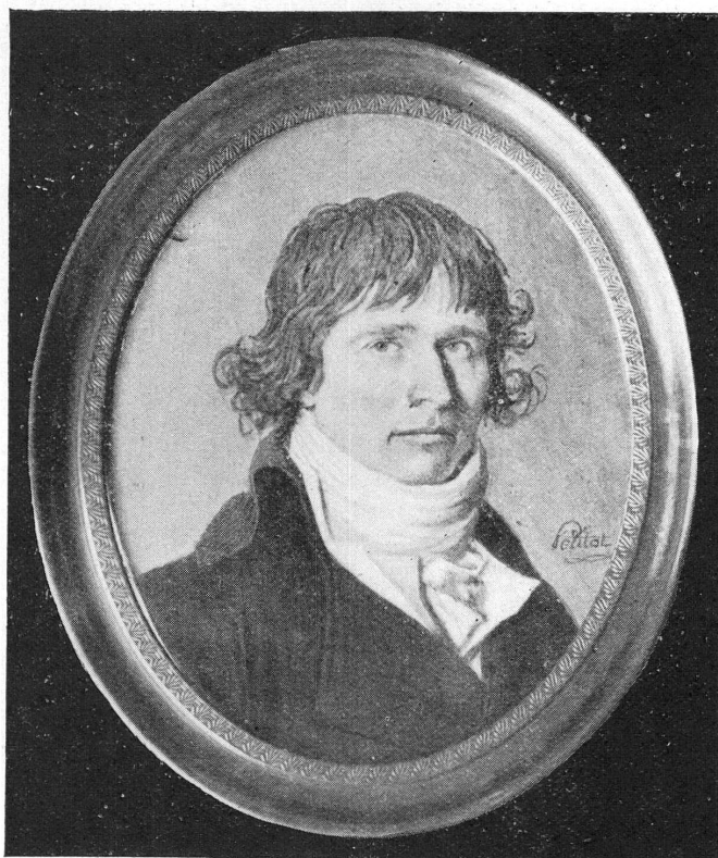
FIG. 4. — Portrait d'homme, époque de la Révolution, miniature sur ivoire, signée Petitot, Ecole française, XVIII e siècle.)

Nous avons gardé pour la fin l'acquisition la plus importante à tous points de vue : celle de la fameuse montre de « HUAUD l'aîné », le plus célèbre des trois frères Huaud, fondateurs de l'industrie genevoise de la peinture en émail sur boîtiers