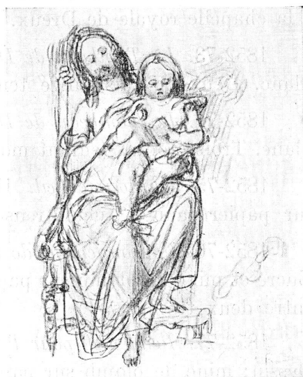
FIG. 3. — Le signe de croix.

1852-64. Puget . H. 0,17; L. 0,114. Croquis; mine de plomb sur papier blanc. Notice de Lequesne: « Première pensée de la statue de Puget commandée par la ville de Marseille et dont l'esquisse seule a été faite ». (Groupe; Puget est appuyé contre la statue colossale de Milon de Crotone.)