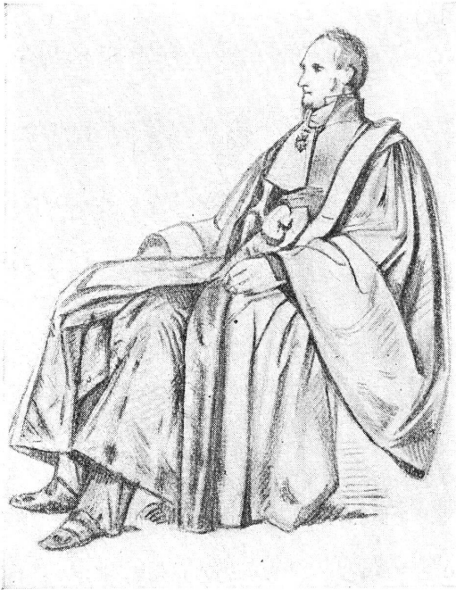
FIG. 2. — M. de Belleyne.

1852-48. Le général Damême . H. 0,23; L. 0,14. Deux croquis (figure en pied, tête nue; tête avec bicorné). Mine de plomb sur papier blanc. Notice de Lequesne: « Croquis de M. Pradier pour le concours de la statue du général Damême ». Cette statue n'est pas citée par Lami. Pas d'autre renseignement.