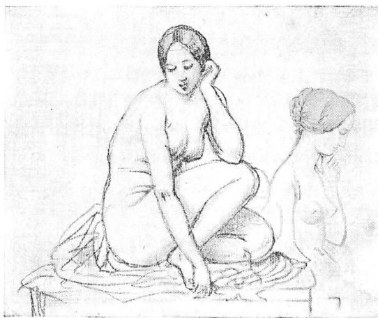
FIG. 1. — Femme accroupie.

1852-41. La ville de Nîmes; enfants pour le groupe du Dolce farniente; une victoire pour le tombeau de Napoléon . H. 0,20; L. 0,27. Croquis; mine de plomb sur papier blanc. Le groupe du Dolce farniente n'est pas cité par Lami; la notice de Lequesne ne dit pas s'il a été exécuté.