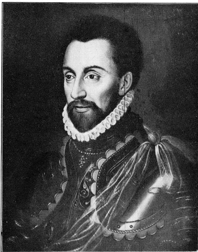
FIG. 1. — Portrait de Louis de Bourbon, prince de Condé. Bibliothèque publique.

A vrai dire, ce portrait présente peu d'analogie avec ceux qu'on connaît du duc de Guise, et nos doutes à ce sujet ont été confirmés par plusieurs preuves. Un portrait gravé, entrevu fortuitement en tête des Mémoires de Condé (Londres 1743), et qui représente Louis de Bourbon, 1 er prince de Condé (1530-1569), nous a mis sur la voie: les traits de ce personnage offrent une ressemblance marquée avec ceux