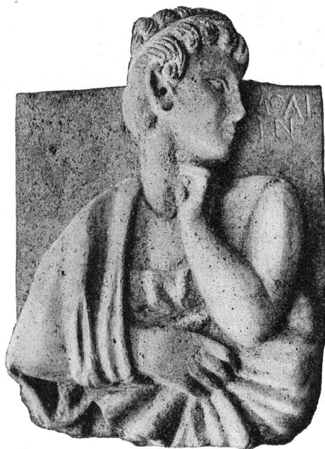
FIG. 1. — Relief de Damas.

4. — 12682. — Relief en calcaire . Buste de jeune homme, imberbe, de face, à courte chevelure bouclée que ceint un diadème, drapé. La tête est tournée à sa