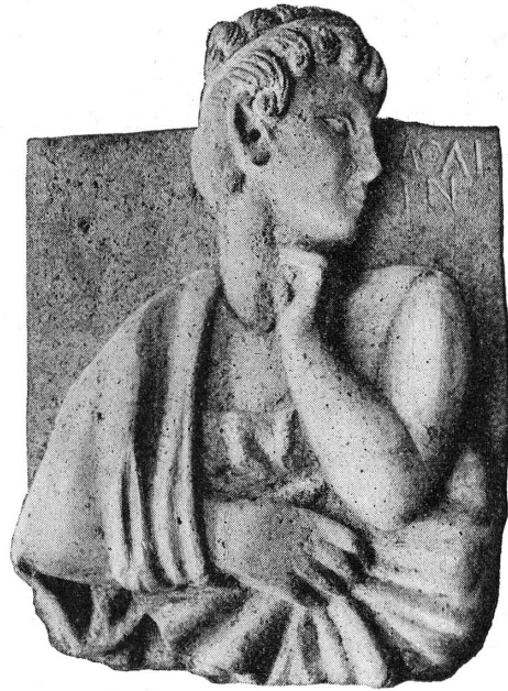
FIG. 1. — Relief de Damas.

4. — 12682. — Relief en calcaire . Buste de jeune homme, imberbe, de face, à courte chevelure bouclée que ceint un diadème, drapé. La tête est tournée à sa