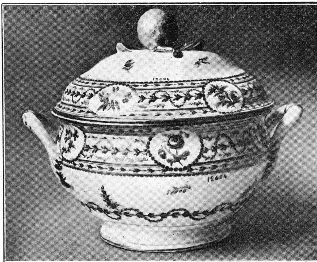
FIG. 3. — 12684. Soupière en porcelaine de Nyon.

12693. — Tasse et soucoupe en porcelaine de Genève (début XIX e siècle), forme droite, décor or, soit le monogramme J. T. A. dans une guirlande de pensées, soucoupe