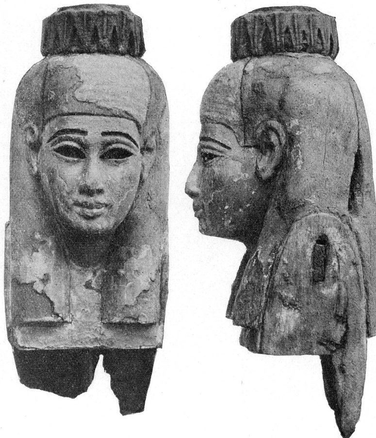
FIG. 2. — 12704. Statuette égyptienne.

12680-3, 12703, 12706-713. — Sculptures en marbre. Voir plus loin.