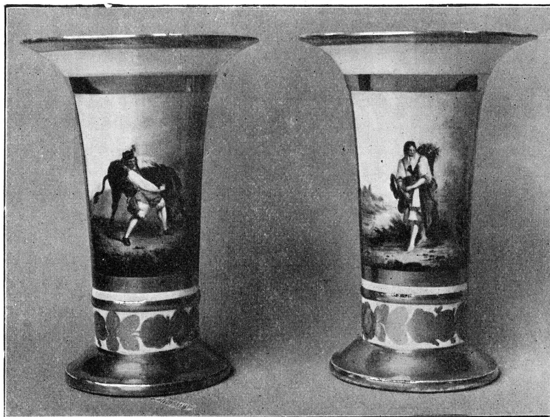
FIG. 4. — 12691. Deux vases en porcelaine de Genève.

12691. — Deux vases en porcelaine de Genève, forme cornet évasé. Décor polychrome et or; sur l'un des vases, paysanne passant un gué; sur l'autre, bouvier luttant avec un taureau. Marque P. M. (Mulhauser). Haut. 0,19 (fig. 4).