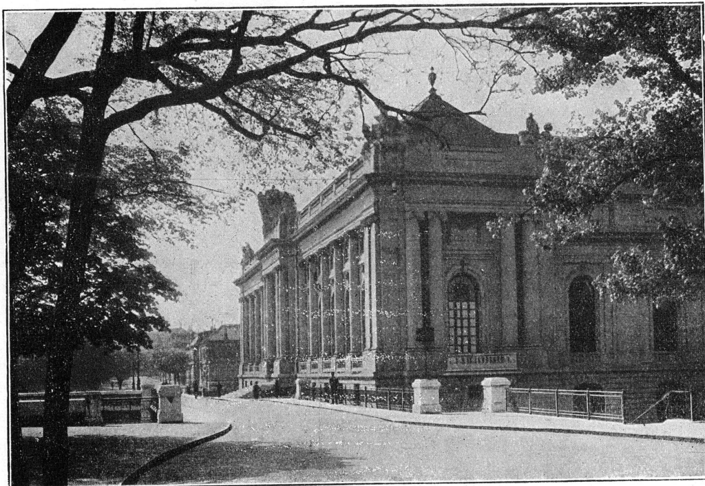
Musée d'Art et d'Histoire — Genève.