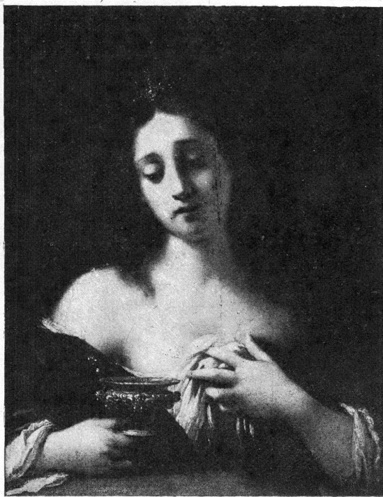
FIG. 2. — GUIDO RENI. Artémise.

John-Francis Rigaud, né à Turin en 1742, d'une famille française protestante émigrée, se rend en Angleterre en 1772 et y meurt en 1810.