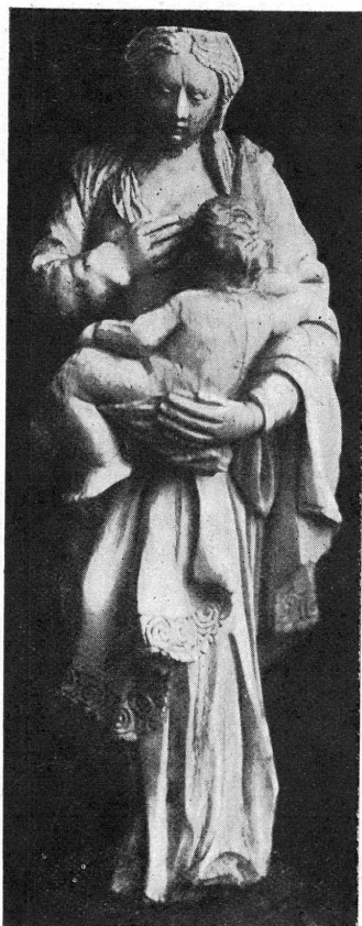
12305. — Ivoire. Statuette.

A l'exception de quelques objets de genres et d'époques divers, ce sont surtout des monuments de l'ancien art religieux des XII-XVII e siècle, et spécialement des ivoires sculptés, statuettes, feuillets de diptyques, etc. Si malheureusement un grand nombre de ces objets sont faux ou douteux, il en demeure qui ont une grande valeur artistique, et qui sont infiniment précieux pour nos collections encore peu abondantes en documents de ce genre.