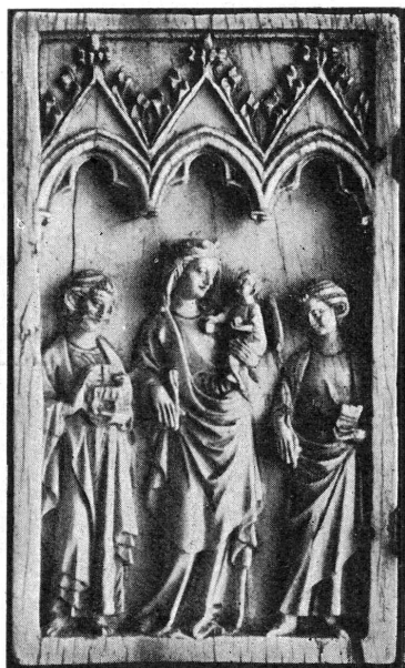
12260. — Ivoire. Feuillet gauche de diptyque.