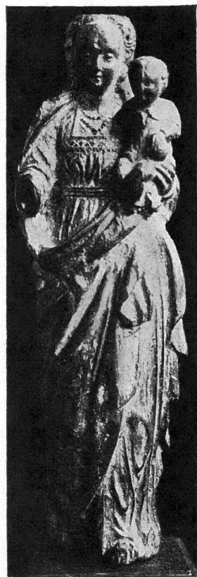
12306. — Bois doré. Statuette.

1261. Ivoire. Feuille gauche de diptyque. Dans une triple arcature trilobée, la Nativité. La Vierge étendue sur un lit berce de la main gauche l'Enfant emmaillotté, couché dans un berceau, près duquel le bœuf et l'âne sont accroupis. Au pied du lit, Saint Joseph. Dans le fond, l'Ange apparaît à un berger entouré de ses troupeaux (chien