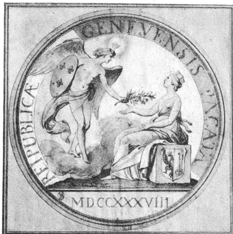
Fig. 2. — Dessin de Bouchardon (Bibliothèque de Genève).