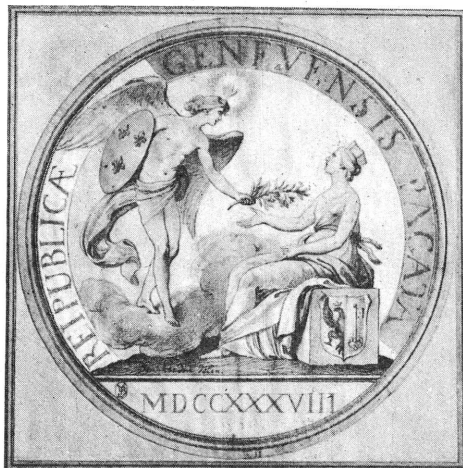
Fig. 2. — Dessin de Bouchardon (Bibliothèque de Genève).