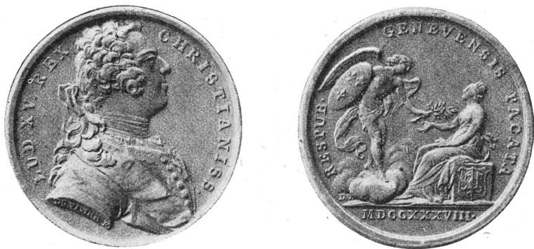
Fig. 1. — Médaille de Du Vivier (Cabinet de Numismatique de Genève, n° 52273).

4. Haller 2 rapporte, en effet, que le syndic Calandrini envoya aux tireurs de la Coulouvrenière une médaille sur laquelle il avait fait graver que le plan de Médiation fut accepté sous sa présidence dans le Conseil Général, et que c'est cette décision qui fit cesser les troubles.