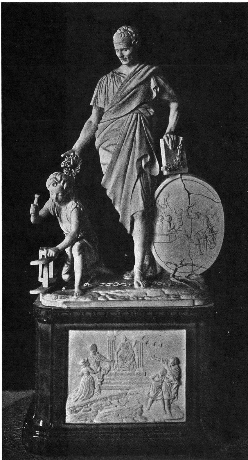
L'éducation d'Emile. Biscuit de Niederwiller. Musée de Genève.