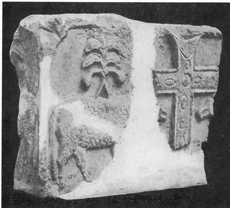
FIG. 1. — Musée de Genève. Collections lapidaires, nos 4738, 4739.

Les sculptures furent signalées d'abord par M. W. Deonna 1 et étudiées plus tard dans un article spécial, déjà cité, par M. L. Blondel. Celui-ci décrit d'une façon détaillée la découverte des fragments au cours des fouilles exécutées, en