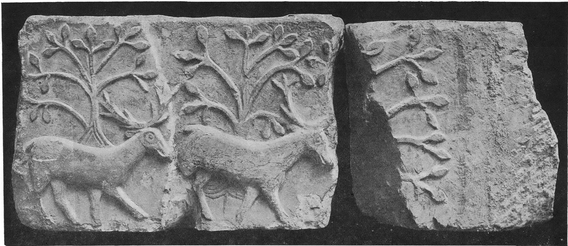
FIG. 2. — Musée de Genève. Collections lapidaires, n os 4736, 4737.