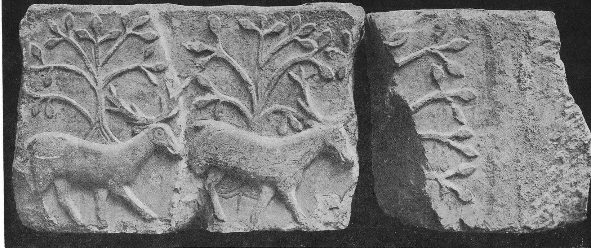
FIG. 2. — Musée de Genève. Collections lapidaires, n os 4736, 4737.