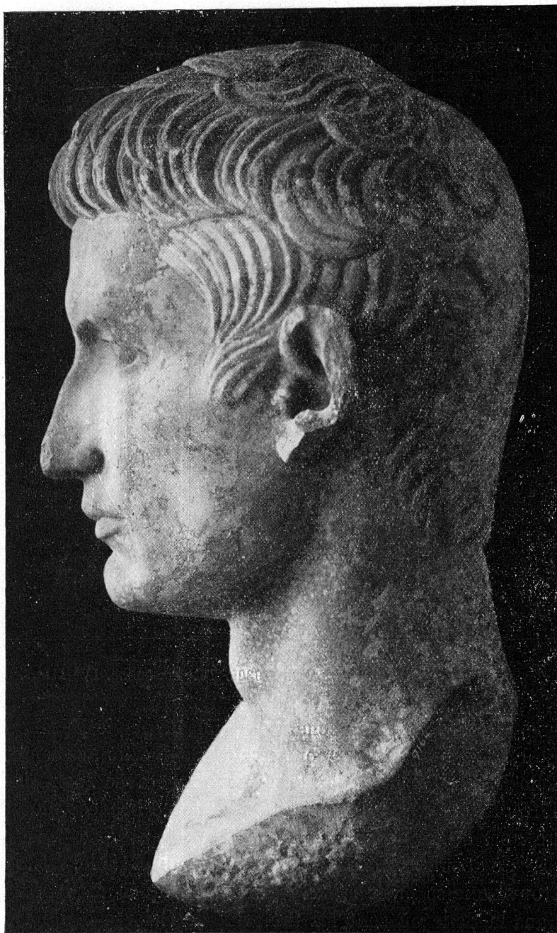
FIG. 27. — 9164. Tête d'Auguste.

à des conditions très favorables pour nous, d'un des plus beaux bouquets de fleurs