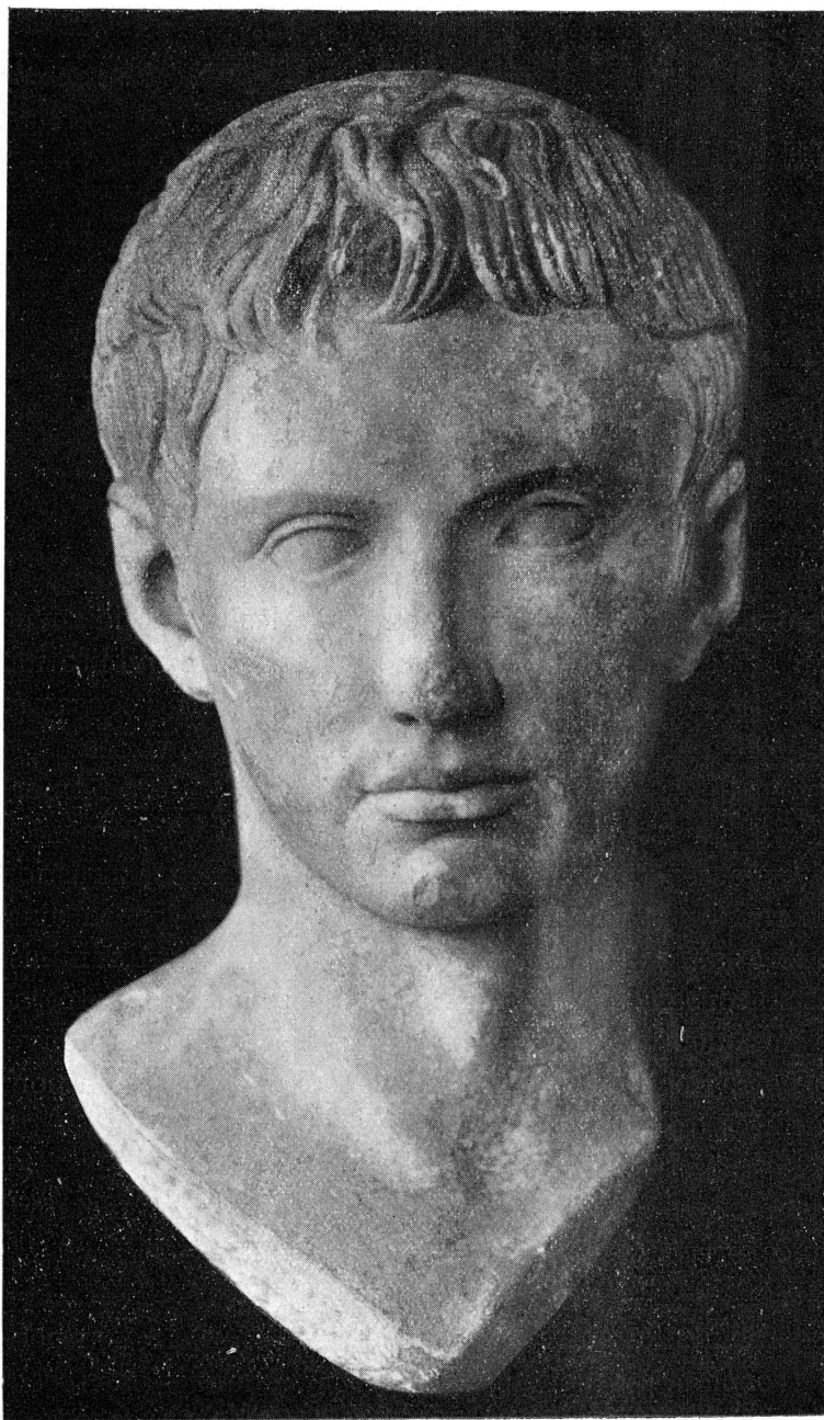
FIG. 26. — 9164. Tête d'Auguste.

Depuis quelques mois, le directeur du Musée était en tractation pour acquérir un buste de marbre, portrait de l'empereur Auguste d'un très beau style et dans un état remarquable de conservation. Nous avons donné une subvention importante à cet achat qui a été facilité, du reste, par un don anonyme. Ce buste doit provenir de Tarente. ( Fig. 26-7 ).