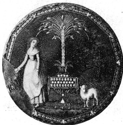
FIG. 4. — Fond de montre émaillé sur cuivre en bleu-de-roi peint et enrichi de paillons grippés.