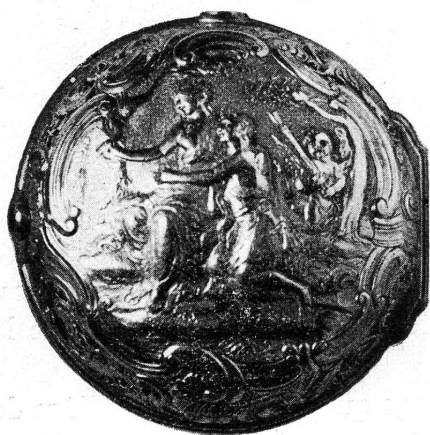
FIG. 2. — Etui-boîtier or, de la montre signée David Trembley. Genève, XVIII me siècle.

de pierres précieuses, forment avec les reflets changeants des émaux translucides, des accords incomparables. Ce sont Watteau, Lancret, Baudouin, Boucher, Natoire, Fragonard, Greuze, les petits illustrateurs et aussi les ornemanistes qui