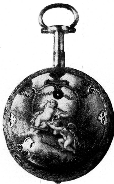
FIG. — Boîtier intérieur de la montre signée David Trembley. Genève, XVIII me siècle.

inspirent ces peintres. Les groupes mythologiques, les allégories imprégnées de l'atmosphère voluptueuse de l'époque, les scènes du temps, personnages de la