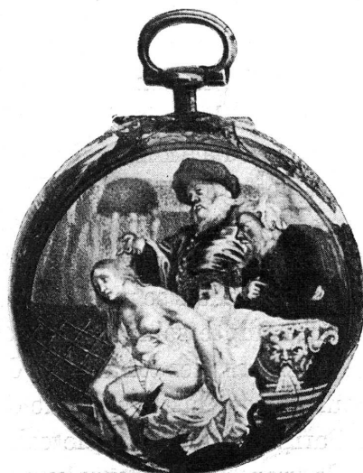
FIG. 1. — Montre de Frederik Soret. Londres, XVII e siècle.

Sur le fond, la scène de « Suzanne et les vieillards » s'enlève en une belle mise en page, d'une liberté d'allure, d'une hardiesse de dessin et de modelé admirables; les pourpres magnifiques, les jaunes d'or éclatants des costumes des vieillards, contrastent avec les draperies bleues, les blancs froids, les carnations argentines du corps de Suzanne, et se détachent sur les gris verdissants du jardin dans le lointain. Cette peinture est entourée de beaux médaillons de paysages qui la relient au cadran représentant Vénus et l'Amour. Sur le contre-émail, un beau paysage de grand style complète cette très belle décoration rappelant certaines œuvres de l'Ecole de Blois, et qui semble d'un style et d'un caractère supérieurs à celles des Huaut 1 .