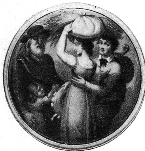
FIG. 6. — Fond de montre à sujet rustique.

Peu à peu le sens de la mesure dans l'arrangement, la recherche de l'harmonie diminuent. Les peintres reproduisent trop fréquemment des œuvres de style médiocre d'un classicisme attardé ou d'un romantisme fade; seul le métier reste incomparable et, malgré sa froide perfection, force l'admiration. C'est l'époque des montres entourées de perles, recouvertes sur tout le fond de grands sujets à figures, des tabatières, boîtes à musique, à automates, où chacun des éléments, gravure, émail, peinture, est traité pour lui-même de façon parfaite, sans parvenir à former un ensemble. Seules les pièces décorées de bouquets, de paniers de fleurs et de fruits sont presque toujours d'une composition remarquable, d'une couleur franche et d'un éclat qui s'accorde aux splendides émaux transparents des fonds. C'est la peinture de fleurs qui maintient presque seule jusqu'à la fin du XIX e siècle la grande tradition décorative de la peinture sur émail 1 .