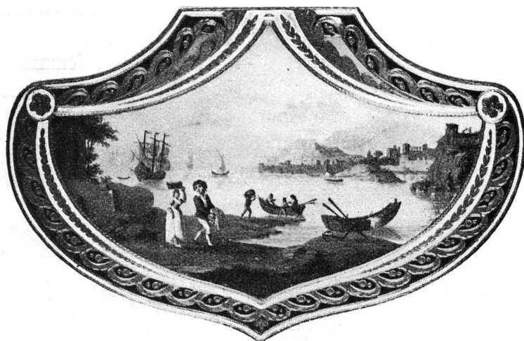
FIG. 5. — Tabatière de J. L. Richter.

Quatre tabatières du Musée d'Art et d'Histoire révèlent en Jean-Louis Richter un peintre et décorateur exceptionnel ( fig. 5 ). Les paysages qui en décorent les couvercles font penser à Hubert-Robert, à Joseph Vernet, aussi à De la Rive: à l'orée d'un bois laissant apercevoir de magnifiques lointains, un chasseur descendu de son cheval ramasse un flamant mort. Dans un médaillon en forme de lyre, de petits bergers gardent des moutons à l'ombre de grands arbres. Un port de mer baigné d'une lumière d'or couvre le couvercle de la troisième. Un fleuve aux rives bordées d'édifices et de groupes d'arbres est peint sur la dernière. Ces quatre paysages, d'une admirable ordonnance classique, peints dans une gamme profonde d'accords mystérieux, enveloppés tantôt d'une atmosphère froide et argentine, tantôt d'une lumière