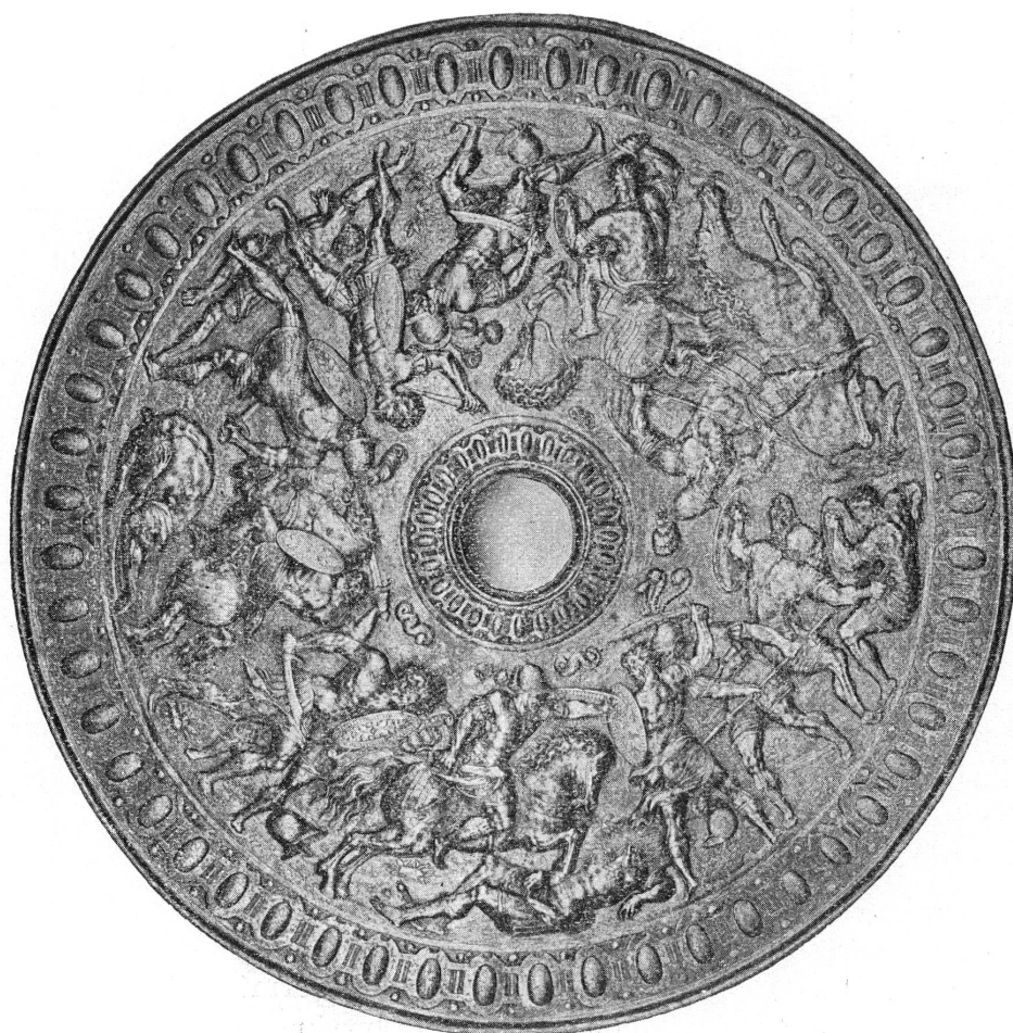
FIG. 1. — Rondache de parement. (Genève, Musée d'Art et d'Histoire, Salle des Armures.)

lature des guerriers, la fougue de leur pose et de leurs mouvements, les armes dont ils se menacent ou dont ils se couvrent ; la ciselure et la gravure ont repris ensuite tous les détails de leur armement, grain des cuiries, bretelles et écailles des armures, gravure des casques et des boucliers, poil des chevaux, broderies des selles et des harnachements, dessins des étoffes mêlées aux vêtements de guerre, plumes des cimiers et des aigrettes. Les traits et l'expression des visages, les yeux, la barbe, le modelé des