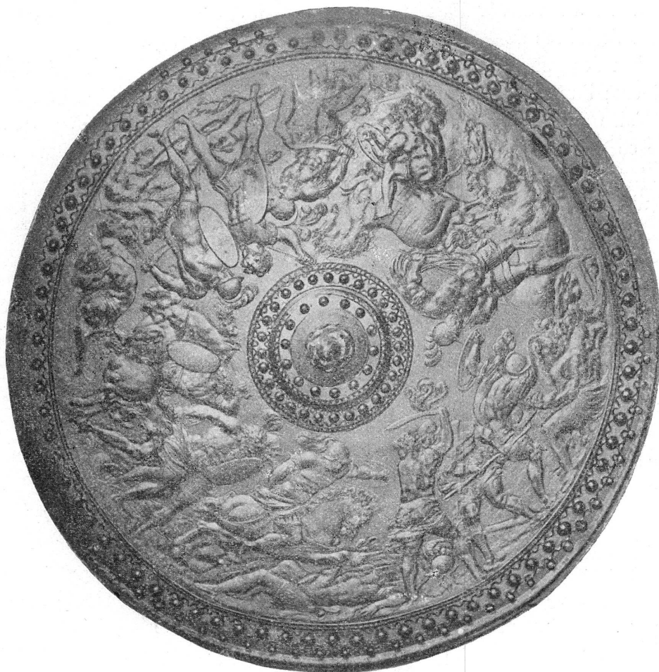
FIG. 6. — Copie allemande de la rondache de Genève. (Musée de Berlin.)

Tout d'abord, elle n'a pas l'entourage d'oves que nous avons décrit et qui est une des caractéristiques du Maître du Louvre; évidemment le dessinateur du modèle