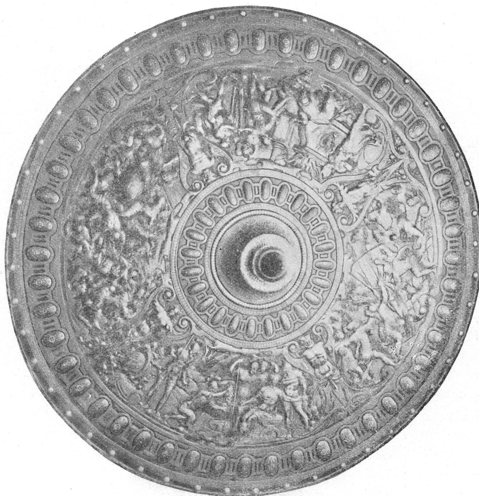
FIG. 2. — Rondache française dite de « Cellini ». (Armerie de Windsor.)

avait appuyé le rayonnement artistique de la Renaissance de toute l'influence qu'elle avait alors en Europe, avait bien aussi quelques droits; mais, aisés à revendiquer dans les Arts majeurs, ces droits étaient plus difficiles à établir dans les Arts industriels, et notamment dans les armures repoussées, souvent sans signature. On se rangea volontiers à l'idée qu'il n'y avait eu dans cette branche que deux écoles, et que tout ce qui n'était pas italien était allemand.