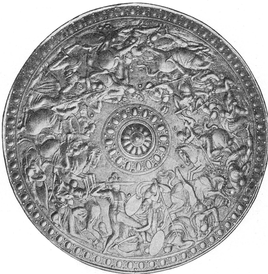
FIG. 5. Rondache de l'école française. (Armerie de Stockholm.)

Incomparables techniciens, les Allemands furent d'ailleurs toujours inférieurs dans la composition et plus portés à s'assimiler un art étranger qu'à créer eux-mêmes un art original. Ils avaient adopté dès son début l'art ogival créé dans l'Ile-de-France; de même, ils se rattachèrent à la Renaissance italienne, sitôt qu'ils la connurent.