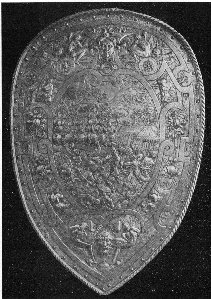
FIG. 3. — Targe de Henri II. (Musée du Louvre.)

Donne-t-il à l'un d'eux une de ces barbes de fleuve qu'il aime à faire flotter sur la poitrine de ses guerriers, il a une façon très personnelle d'en ciseler les ondulations flexueuses, et nul ne sait comme lui donner au métal cet aspect de molle souplesse qui contraste avec la barbe et les cheveux crépus d'autres personnages des