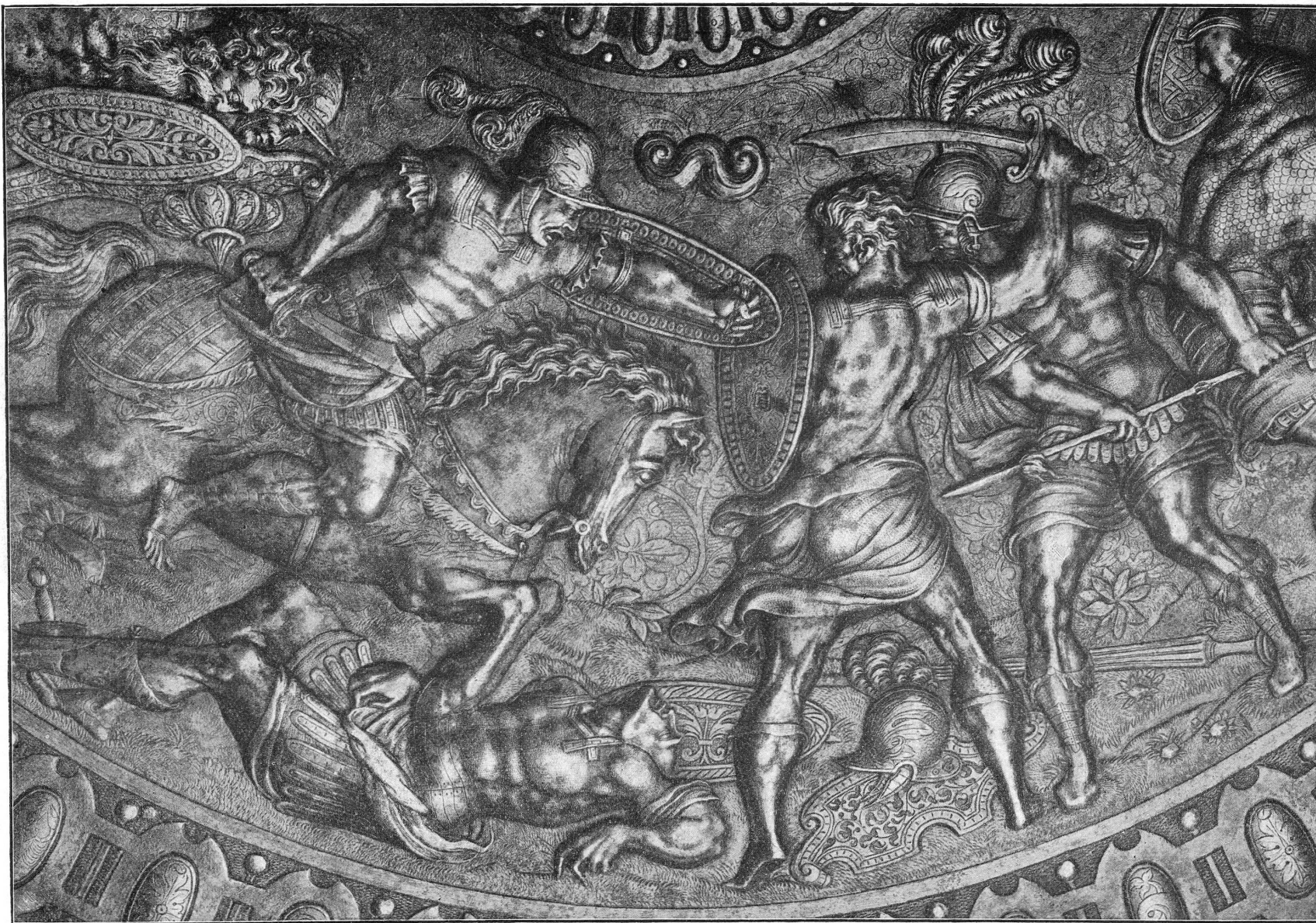
FIG. 4. — Détail de la rondache de parement.