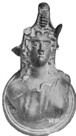
FIG. 2. — Buste de l'Afrique. Musée de Genève, MF. 81.

M. F. 81. — Ibid. , I, p. 26; Pagenstecher, Die Kalenische Reliefkeramik , 1909, p. 175, 167, fig. 52 (fig. 2); BEHN, Altertümer unserer heidnischen Vorzeit, Central-Museum in Mainz , Band V, Heft XI, p. 385-6, fig. 2 et pl. 66, n° 1215.