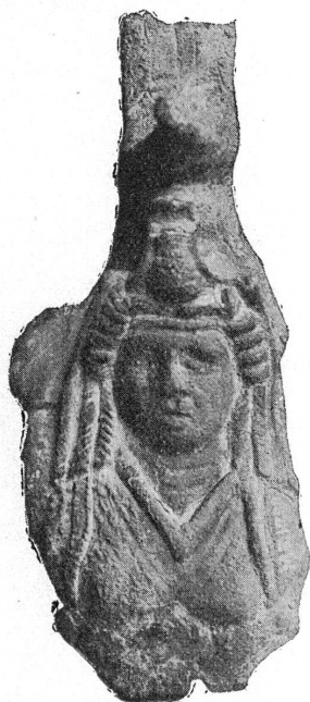
FIG. 1. — Buste de l'Afrique. Musée de Genève, MF. 1208.

Applique ornant la partie inférieure d'une anse de vase en bronze. Buste féminin, de face. Trois grosses boucles tombent d'aplomb de chaque côté du visage, trait distinctif des têtes d'Isis 1 . Sur la tête se dresse une trompe d'éléphant. Le buste repose sur un bouquet de feuilles d'acanthé, motif ornemental fréquent à l'époque romaine 2 .