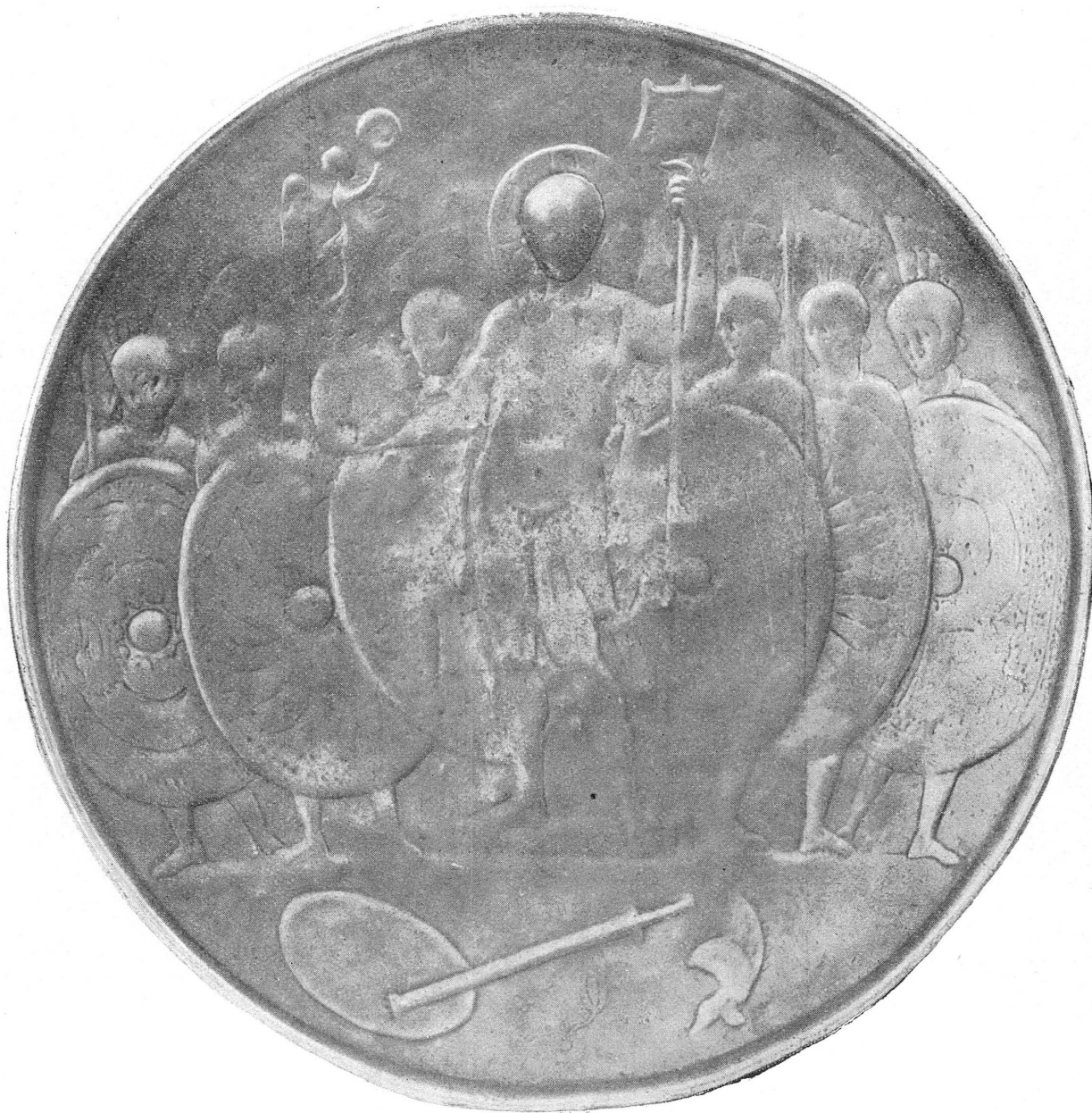
FIG. 2. — Le missorium de Valentinien.