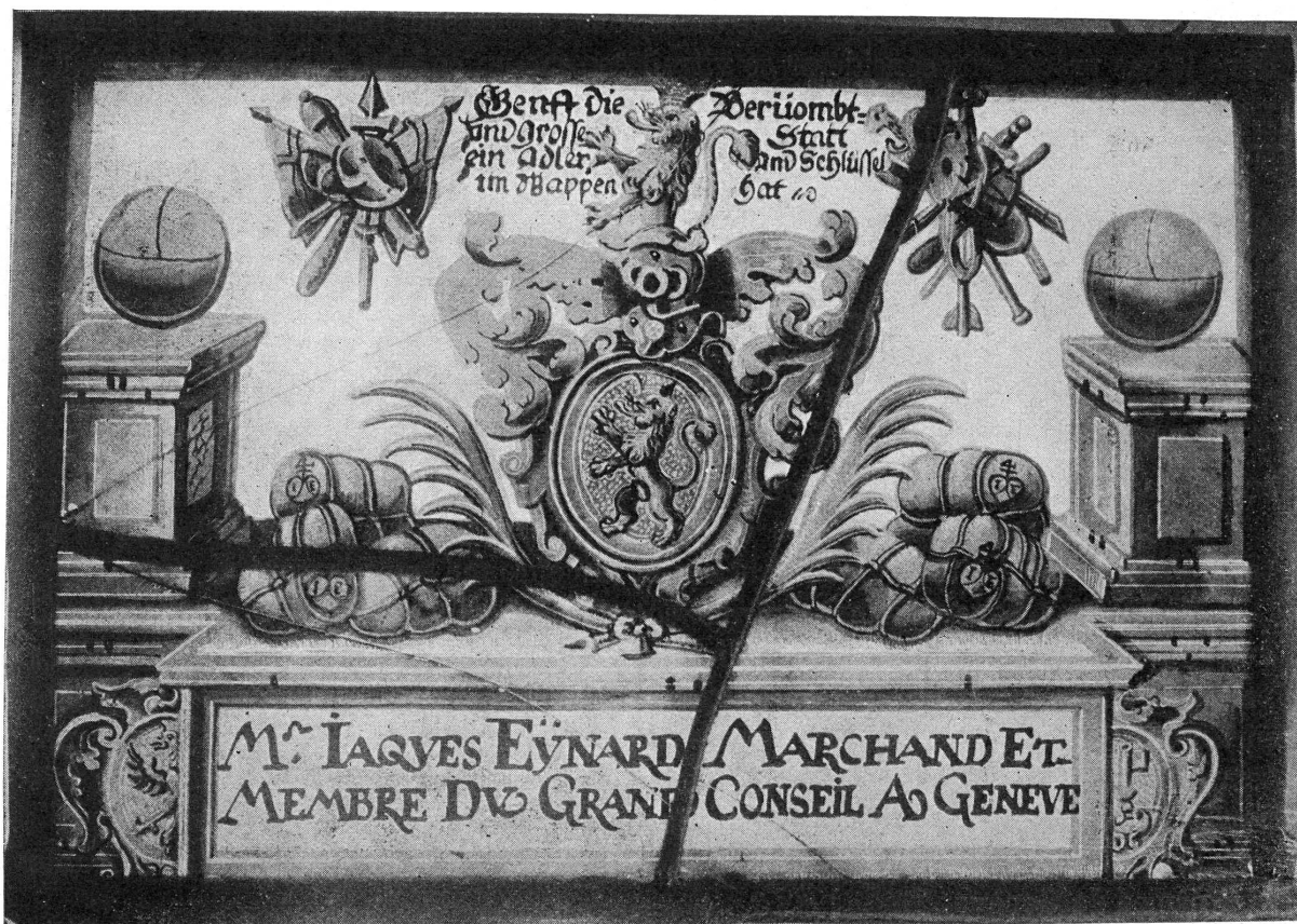
FIG. 3. — Vitrail aux armes de la famille Eynard.

2 o Un fragment de vitrail, qui était un médaillon rond de 20 centimètres environ, de la seconde moitié du XVI e siècle ; il faisait partie de la collection du syndic