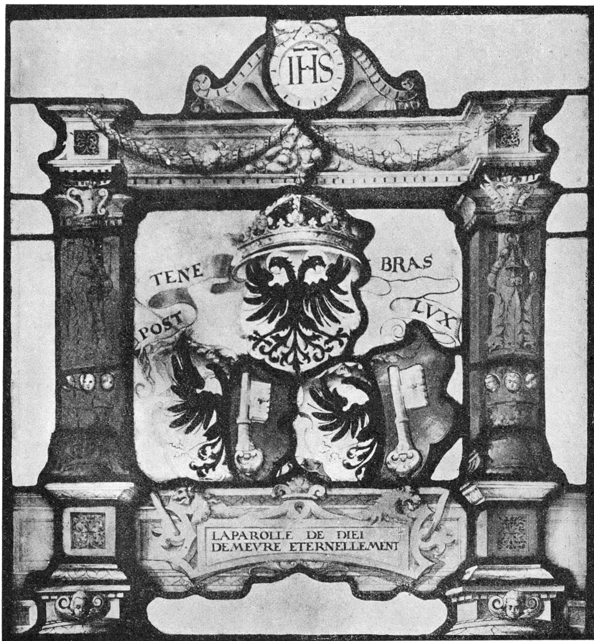
FIG. 2. — Vitrail aux armes de Genève, 1547.

à Paris en décembre 1922; il a été reproduit et décrit dans le catalogue de cette vente 1 , et tout récemment par M. le professeur P. Ganz 2 .