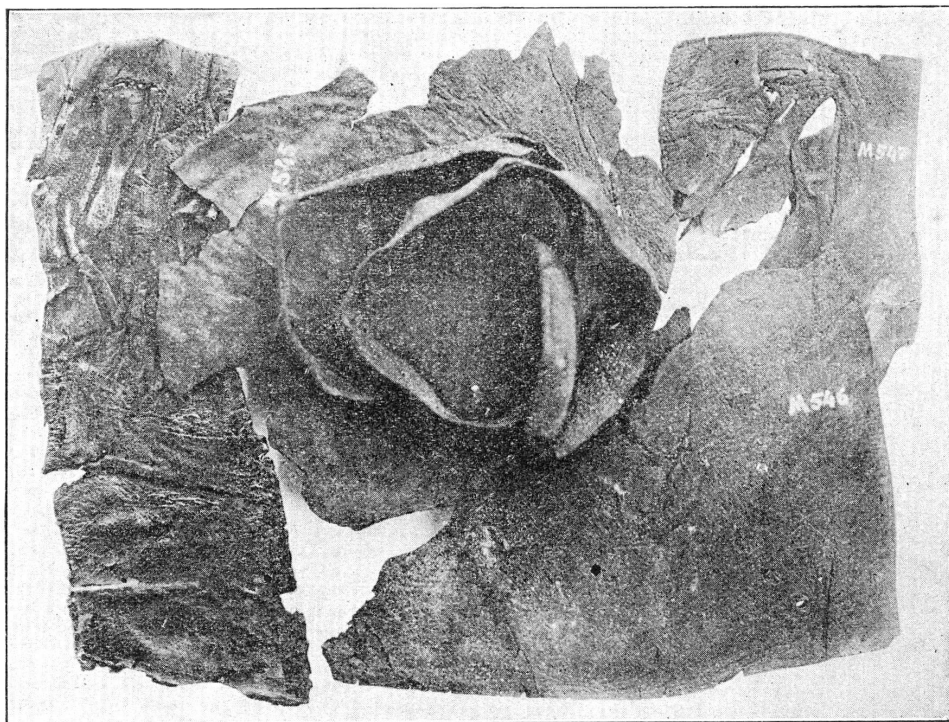
FIG. 1. — Trousse en cuir (Musée de Genève).

Telle qu'elle nous est parvenue, la trousse, consistant en un sac de cuir de forme indéterminable ( fig. 1 ), renfermait dix-neuf outils ( fig. 2 ) à savoir: 13 ciselets à soie, de 107 à 233 mm. de longueur, à tranchant droit, arqué ou arrondi, peut-être même oblique (M. 483) ; une gouge à soie (M. 473) ; une deuxième gouge, plus forte, à tête pour percussion (M. 472) ; une pointe mousse emmanchée (M. 488) ; un tranchet à soie (M. 481) ; une estampe à soie, servant à imprimer un point inscrit dans un cercle (M. 486) ; enfin un long crochet à œillet (M. 487).