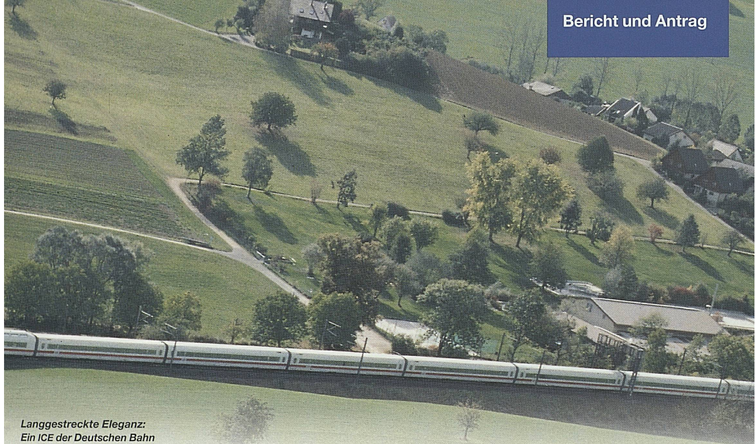
Langgestreckte Eleganz: Ein ICE der Deutschen Bahn in der Baselbieter Land- schaft bei Tecknau.

69,9 Mio. Franken oder 7,5 % hingenommen werden. Daran zeigt sich der nach wie vor ungebrochene Preis- und Konkurrenzdruck im Güterverkehr. Allein bei den Posttransporten brach der Ertrag um 27 % ein. Positiv entwickelt hat sich dagegen der kombinierte Verkehr mit einer Zunahme der Menge um 9 % und des Ertrags um 8,6 %.