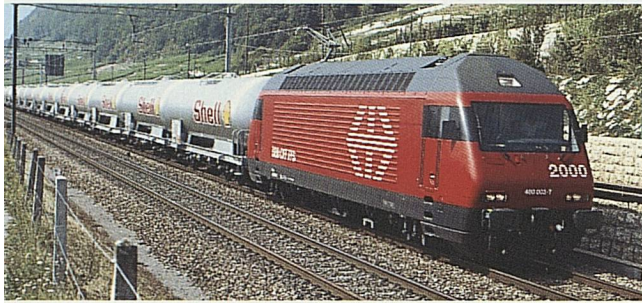
Trotz Wirtschaftsflaute: Ergebnisse knapp gehalten bzw. leicht erhöht.