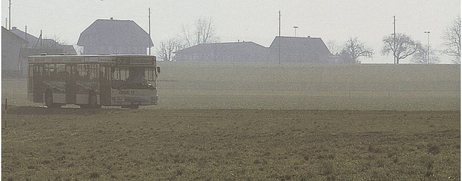
Bus statt Bahn: Erfolgreiche Umstellung auf der Linie Herzogenbuchsee–Soothurn.

Weitere ins Auge springende Neuheit: Die stromlinienförmig gestaltete neue SBB-Lok konnte nach etlichen Verzögerungen auf die Schiene gebracht werden. Die rote Maschine ist zweifellos das Flaggschiff der SBB-Flotte in den kommenden Jahren. 24 von 99 in einer ersten Tranche bestellten Lokomotiven konnten bis Ende 1992 in Betrieb genommen werden, weitere 20 wurden bestellt. Neues Rollmaterial konnte auch für die S-Bahn Zürich, den übrigen Regionalverkehr, den EuroCityverkehr und für den Güterverkehr in Auftrag gegeben werden.