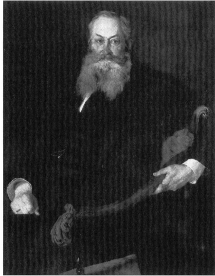
Abb. 7: Wilhelm Leibl, Max Freiherr von Perfall, 1876/77, Öl auf Leinwand, 104 x 83 cm, München, Bayerische Staatsgemäldesammlung, Neue Pinakothek.