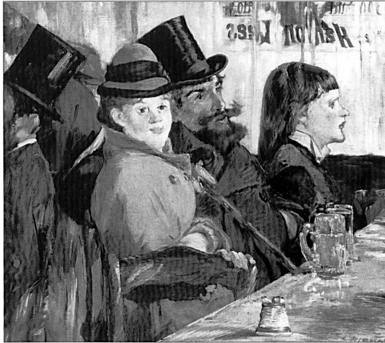
Abb. 2: Edouard Manet, »Au Café«, 1877–78, Öl auf Leinwand, 78 x 84 cm, Winterthur, Sammlung Oskar Reinhart am Römerholz.