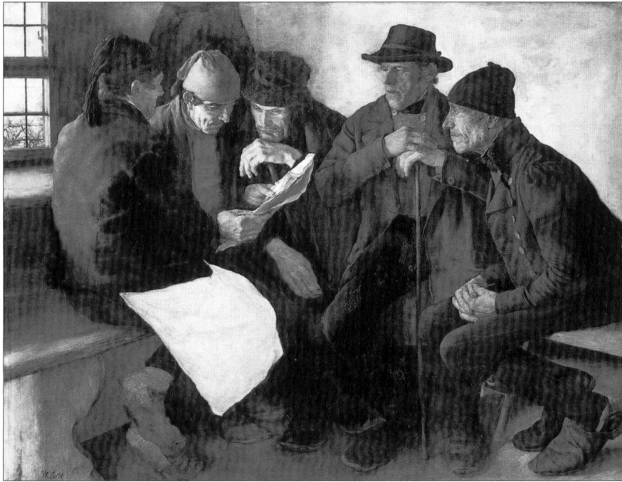
Abb. 1: Wilhelm Leibl, »Die Dorfpolitiker«, 1875–77, Öl auf Holz, 76 x 97 cm, Winterthur, Museum Oskar Reinhart am Stadtgarten.

in seinem Reisetagebuch vermerkte: »Zu Gerstenberg 3/4 St. geplaudert • wenig von den Bildern gesehen. Manet Au Café ganz grosse Klasse.«