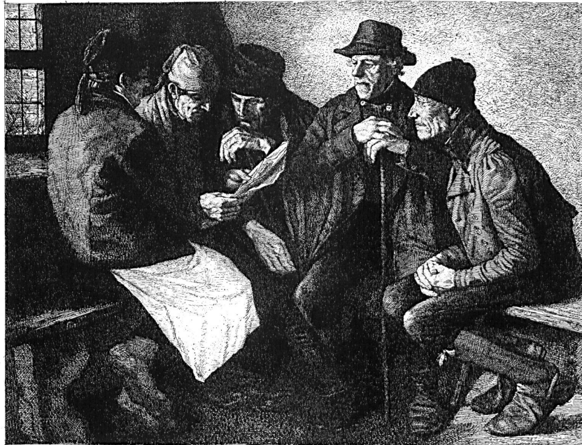
Abb. 6: Ferdinand Leenhoff, Kopie nach Wilhelm Leibl, »Die Dorfpolitiker«, Kupferstich, reproduziert in: L'art, 1879, S. 167.

22 Durantys allgemeine Kritik dürfte kaum auf Leibl gemünzt sein, wie in Kat. Leibl 1994 (wie Anm. 2), S. 149, behauptet. Dort heisst es, Duranty habe mit der Betonung der Handwerkslichkeit den Mangel an sozialem Engagement in den »Dorfpolitikern« kritisiert, wodurch Leibl seine erste negative Besprechung in Paris erhalten habe.