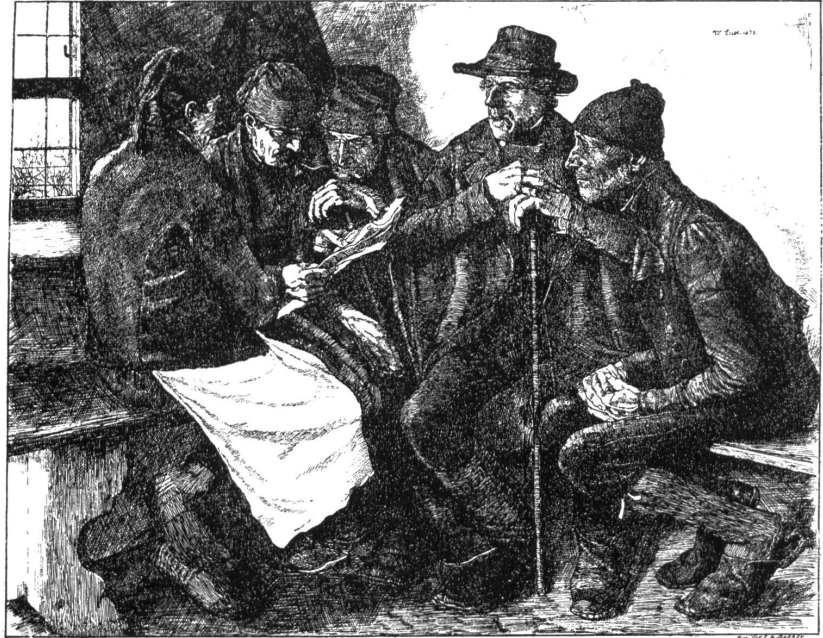
Abb. 5: Wilhelm Leibl, Zeichnung nach »Die Dorfpolitiker«, 1878, reproduziert in: Gazette des Beaux-Arts 18, 1878, S. 153.

reinste französische Malkultur in höchster Vollendung offenbarte, ausgeführt in einer Perfektion, wie sie selbst in Frankreich kaum zu finden war.