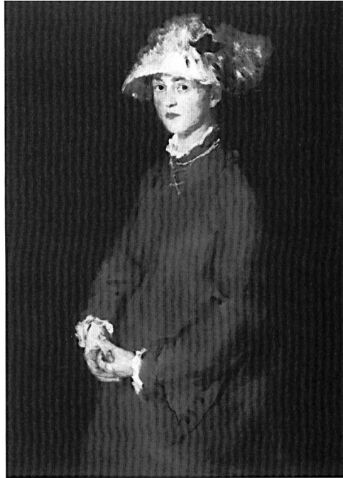
Abb. 4: Wilhelm Leibl, Bildnis Lina Kirchdorffer, 1871, Öl auf Leinwand, III x 83,5 cm, München, Bayerische Staatsgemäldesammlungen, Neue Pinakothek.