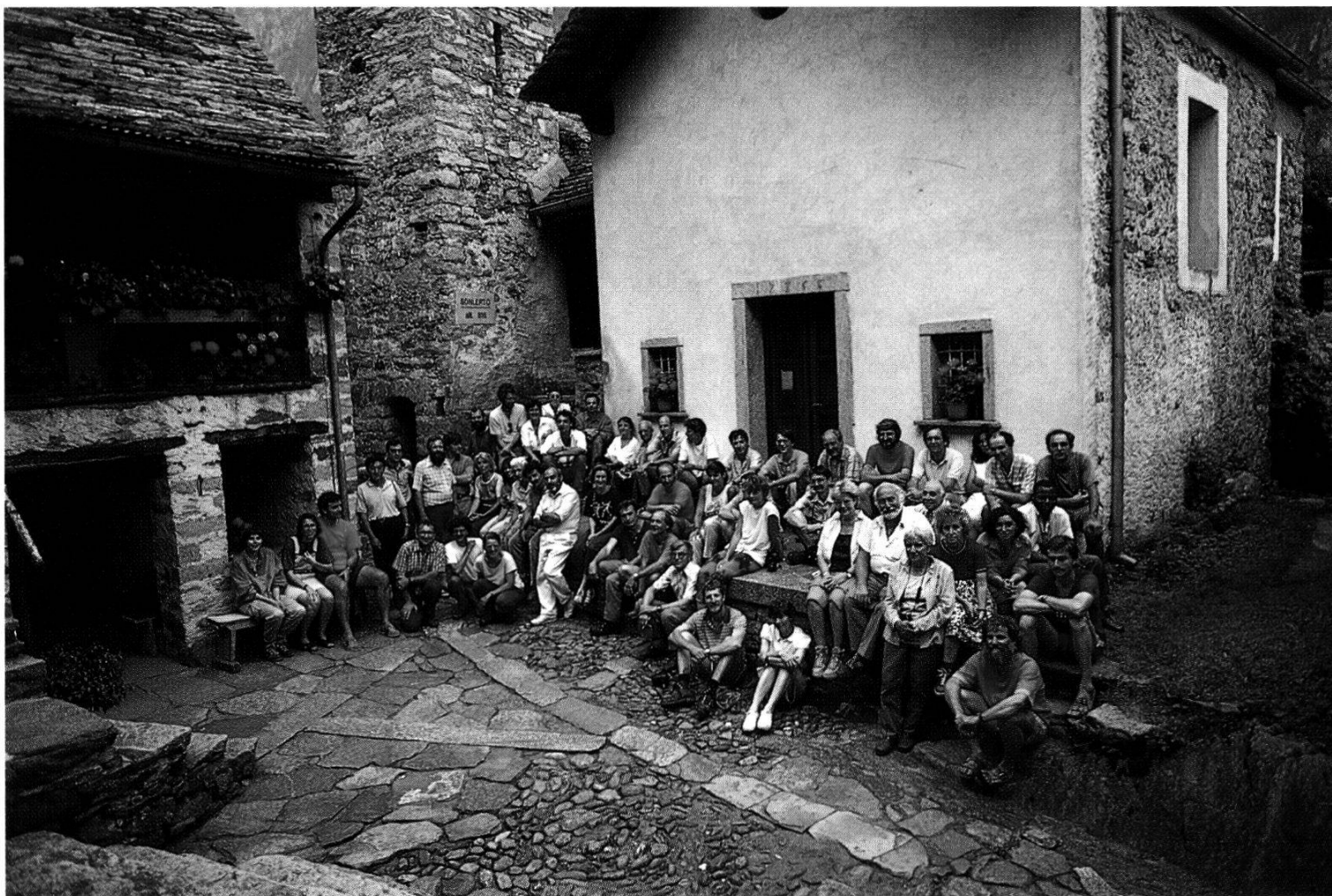
Les participants de l'excursion à Foroglio (Tessin)