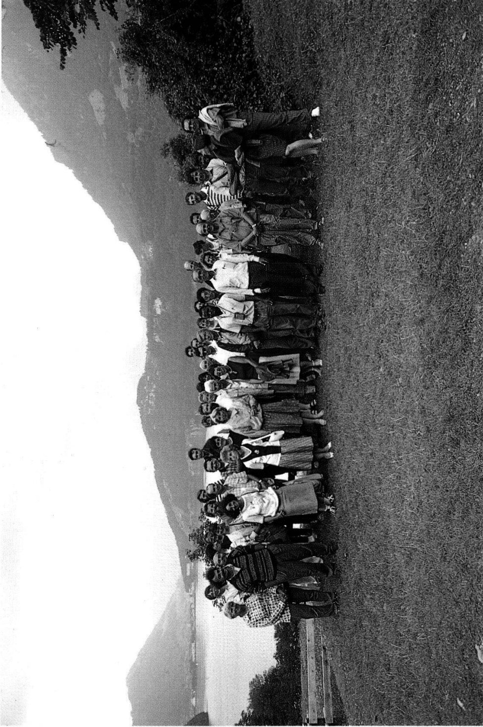
Les participants de l'excursion sur le "Rüti" (Uri)