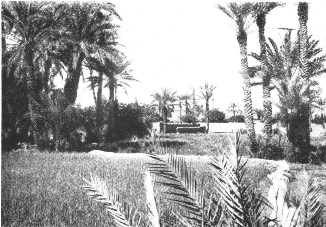
Fig. 1. L'Oasis de Bou Denib, oasis présaharienne typique. — Cultures irriguées. — Orge, Phoenix dactylifera .