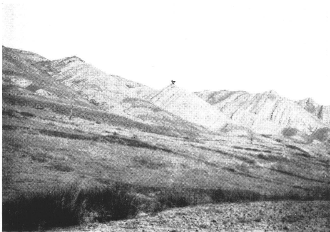
Fig. 1. Le dernier témoin d'une ancienne forêt de Juniperus thurifera . — Grand Atlas oriental entre Tounfite et Anefgou, 2300 m.