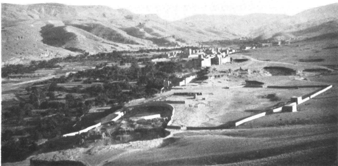
Fig. 2. Une oasis présaharienne, Bou Maln, 1575 m, sans Dattiers, avec Juglans , Ficus , Abricotiers, Olea (rare), Tamarix articulata .