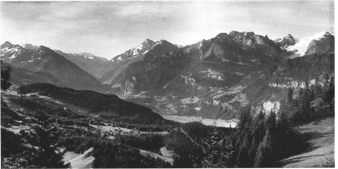
Abb. 1. Die Täler des Oberhasli vom Hasliberg gesehen.