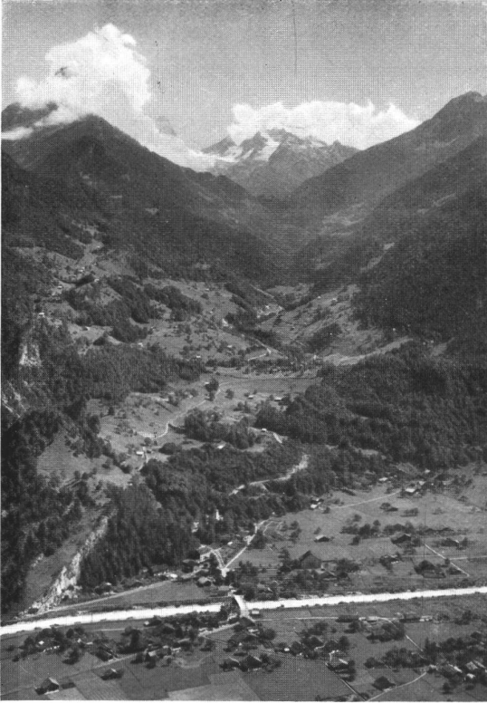
Abb. 2. Blick von Innertkirchen ins Nessental (Gadmental). Links oben Gental.