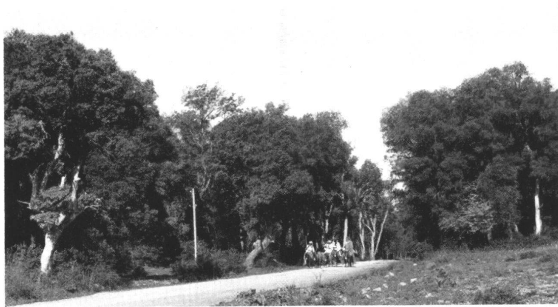
Fig. 2. Forêt de Quercus ilex , faciès humide, au-dessus d'Azrou (Moyen Atlas), à 1600 m., sur calcaire.