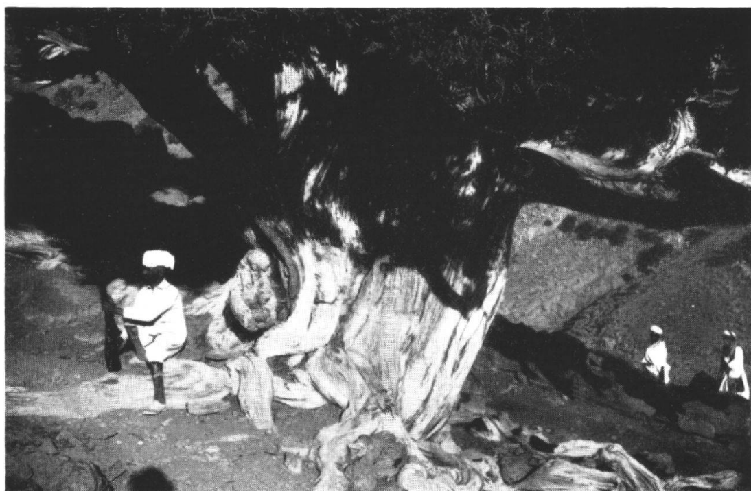
Fig. 2. Un très beau Juniperus thurifera dans le massif de l'Imdghas, à 2700 m.