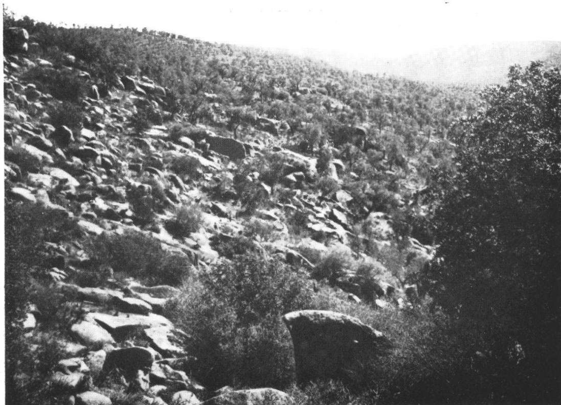
Fig. 1. La forêt de Quercus Suber sur granit, 600—700 m., près Aïn Guernouch (Zaërs). — Forêt sèche avec Pistacia atlantica (1 pied à droite) et Zizyphus Lotus .