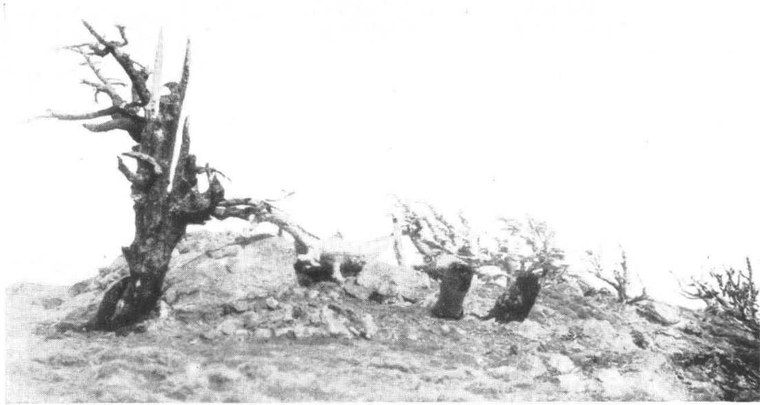
Fig. 1. Ce qui reste de la Cédraie du sommet du Rif, le Tidighine (2450 m.).