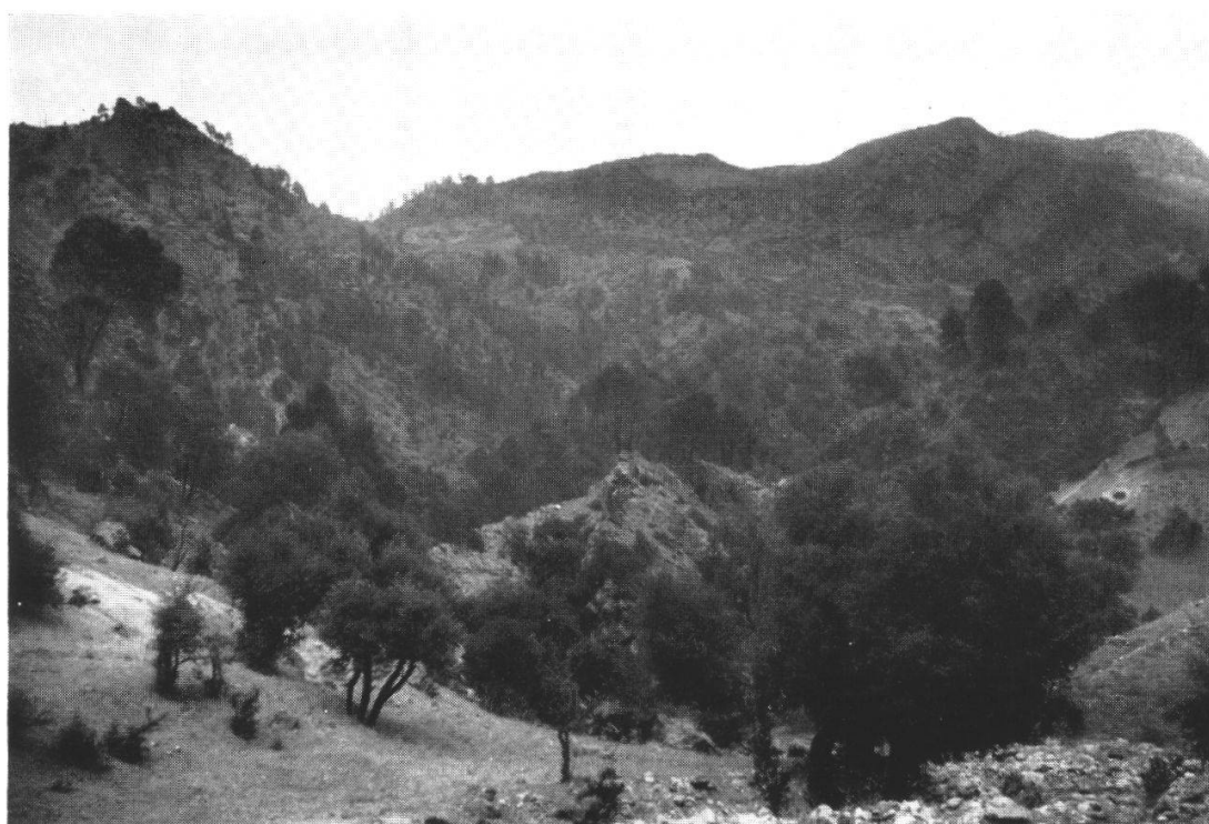
Fig. 2. Forêt de Pinus halepensis avec Quercus ilex dans la vallée de l'Ahansal (Grand Atlas).