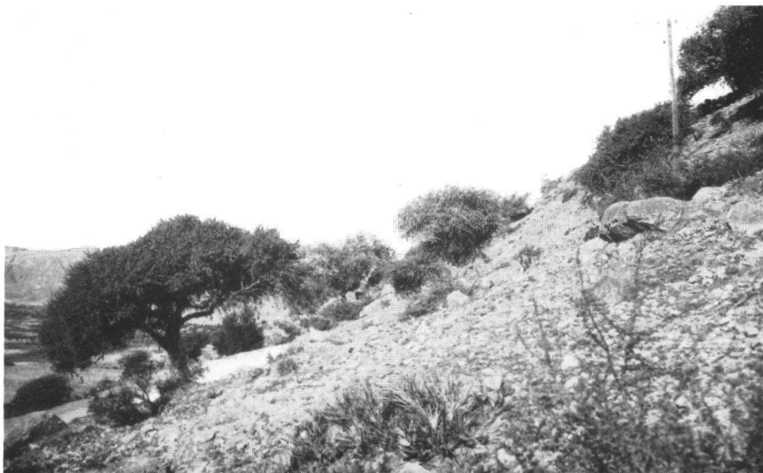
Fig. 2. Bosquets d' Acacia gummifera avec Zizyphus Lotus sur les premières pentes du Grand Atlas. — La présence de Chamaerops indique que nous sommes sur la limite de l'étage aride.