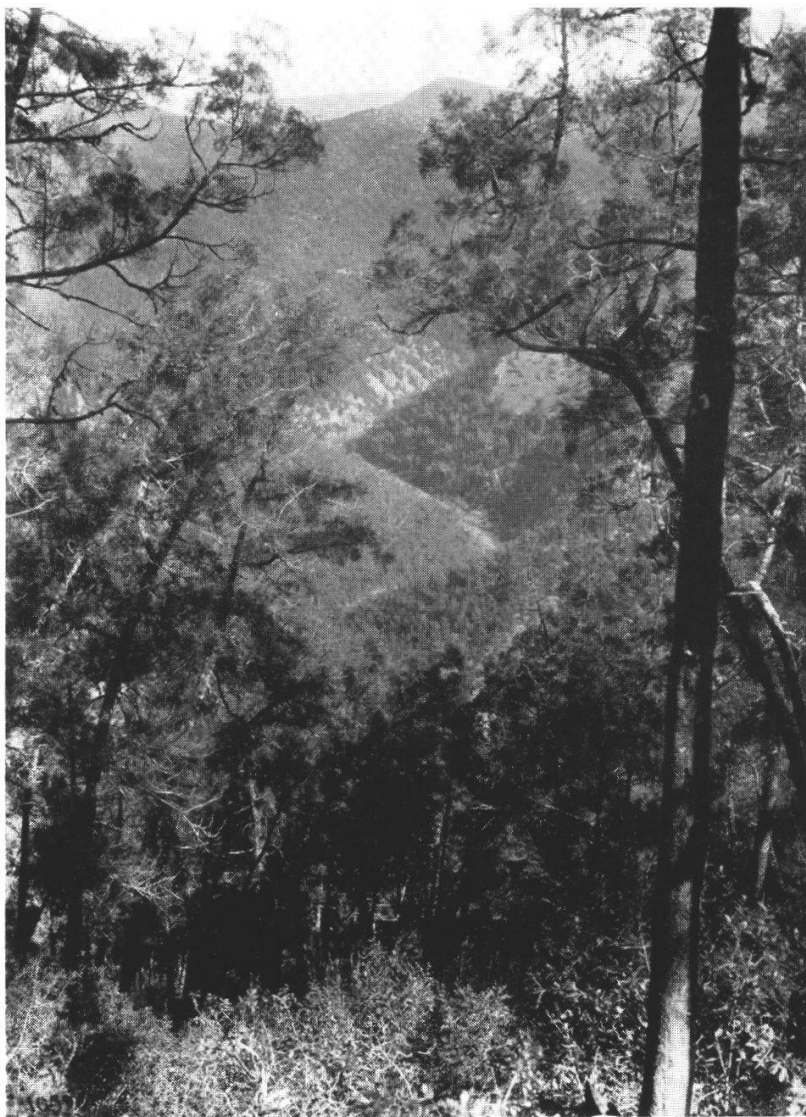
Fig. 1. Forêts de Callitris articulata de la région d'Oulmès.