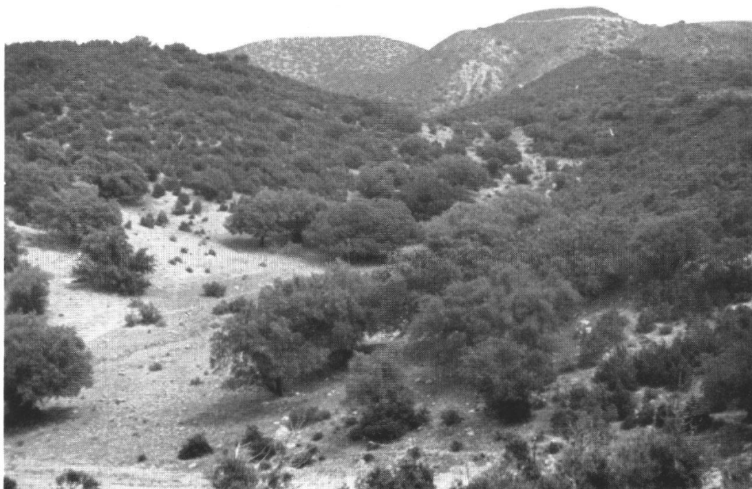
Fig. 1. La forêt d' Argania spinosa dans les montagnes au nord du Cap Ghir, près d'Agadir.