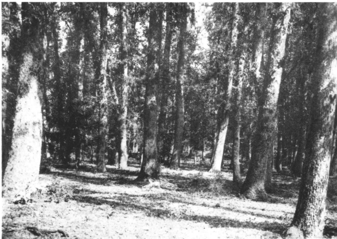
Fig. 1. La forêt de Quercus faginea Lamk. ssp. eu-faginea Maire var. maroccana (Br. Bl. et Maire) Maire, entre Ifrane et Azrou (Moyen Atlas).