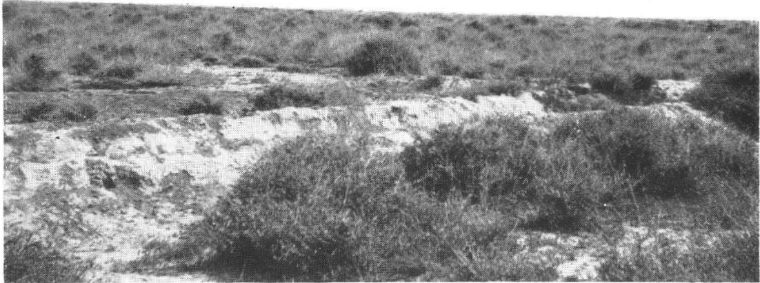
Fig. 1. Végétation des régions les plus arides et plus ou moins salées du Haouz: Atriplex halimus , Lycium intricatum , Asparagus stipularis , Thérophytes.