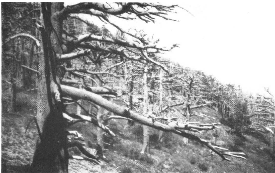
Fig. 2. La Cédraie incendiée sur les flancs du Mont Ighil, 2500—2600 m. (Haute vallée de l'Oued el Abid). — Forêts mortes dans laquelle seuls les Thurifères épars reverdissent.