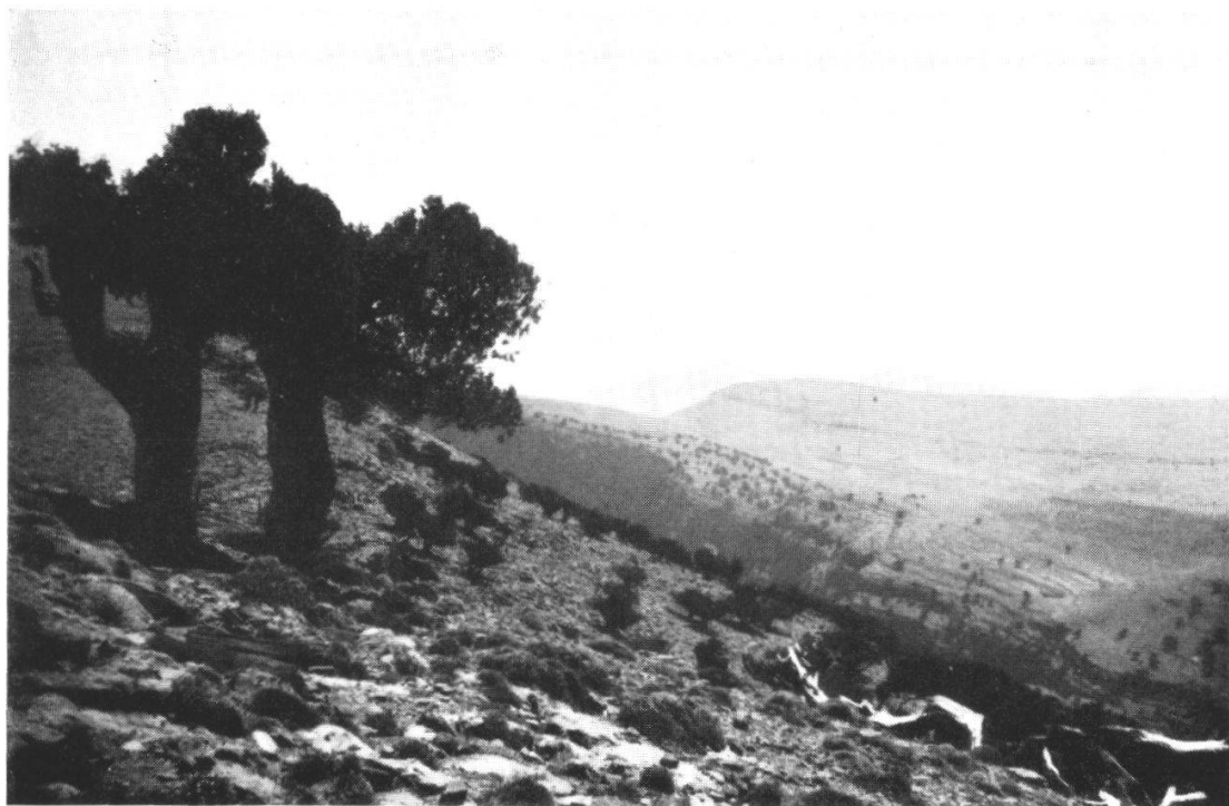
Fig. 1. Boisement de Juniperus thurifera entre 2500 et 3150 m. dans le massif de l'Imdghas.