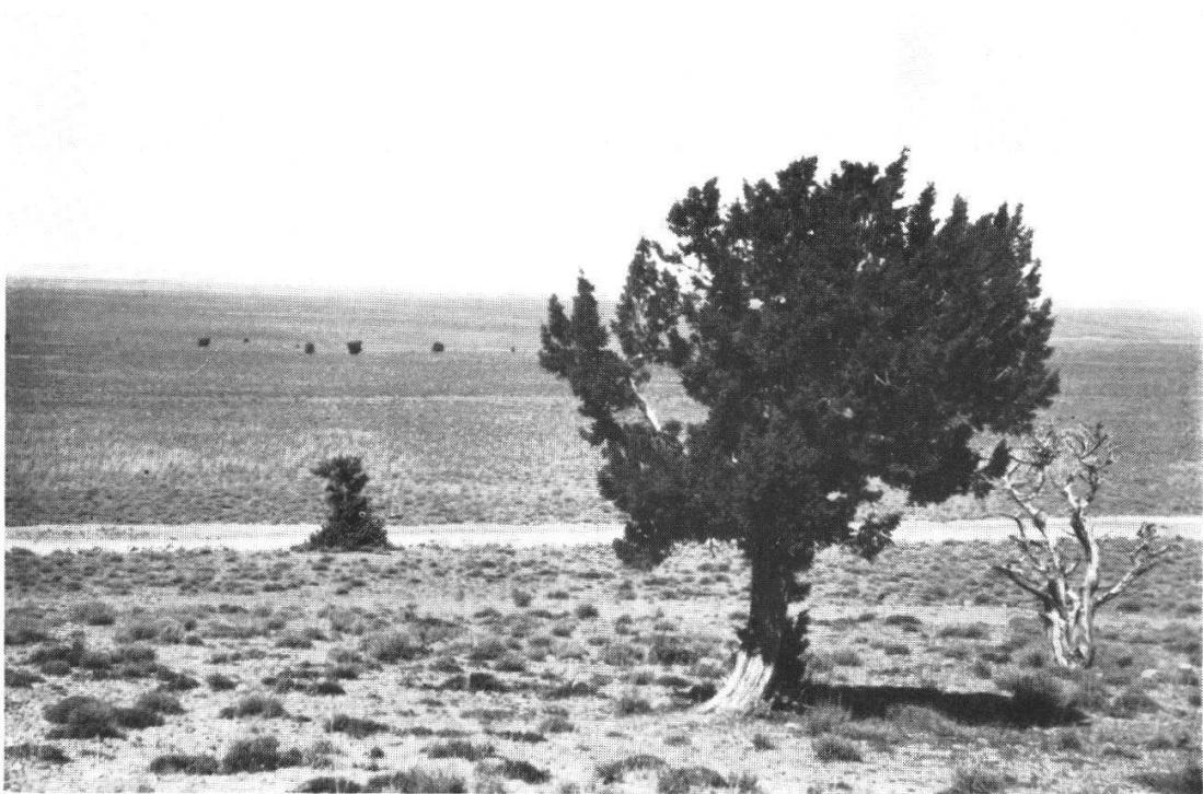
Fig. 2. Les steppes d'Halfa de la Haute Moulouya (1700—1800 m.), vues de la limite climatique des forêts des premières pentes du Grand Atlas près Tounfite. — Juniperus phoenicea et, plus loin, J. Oxycedrus .