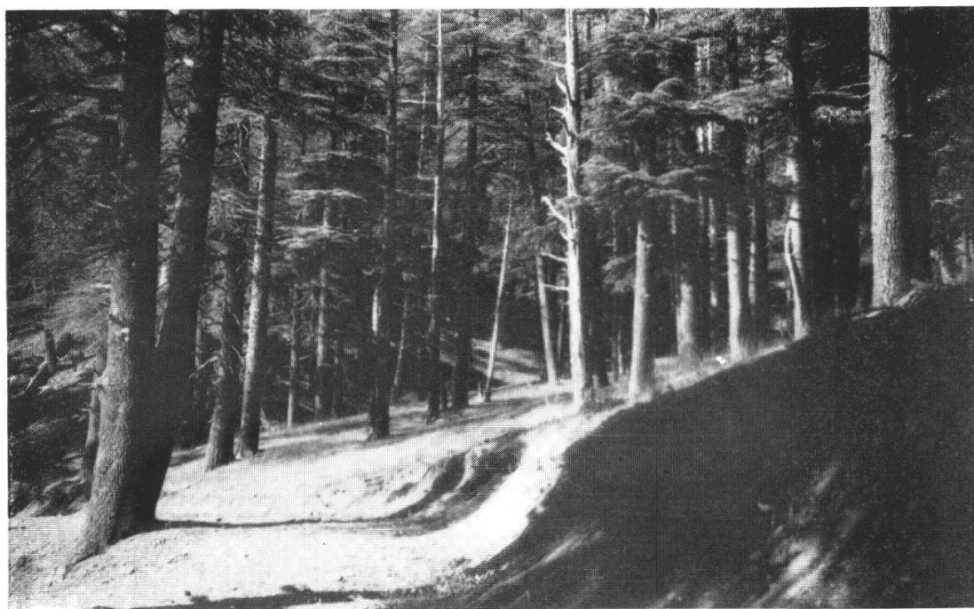
Fig. 1. Une Cédraie intacte près Sidi Yahia ou Youssef, à 2000 m.