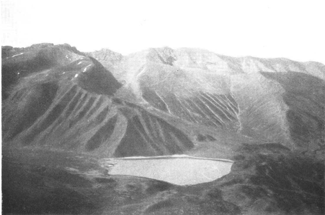
Fig. 2. Le massif du Mgoun (Ht. Atlas) et les deux horizons, l'inférieur à plantes ligneuses en coussinets, le supérieur à plantes exclusivement herbacées. — Photographie prise du sommet de l'Azourki (3650 m.). Le lac d'Azourar est à 2350 m.