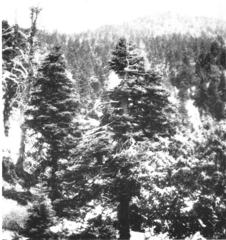
Fig. 2. Forêt d' Abies pinsapo Boiss. ssp. maroccana (Trab.) Emb. et Maire sur les pentes supérieures du Mont Mago, près Chechaouen, à 1800—2000 m.