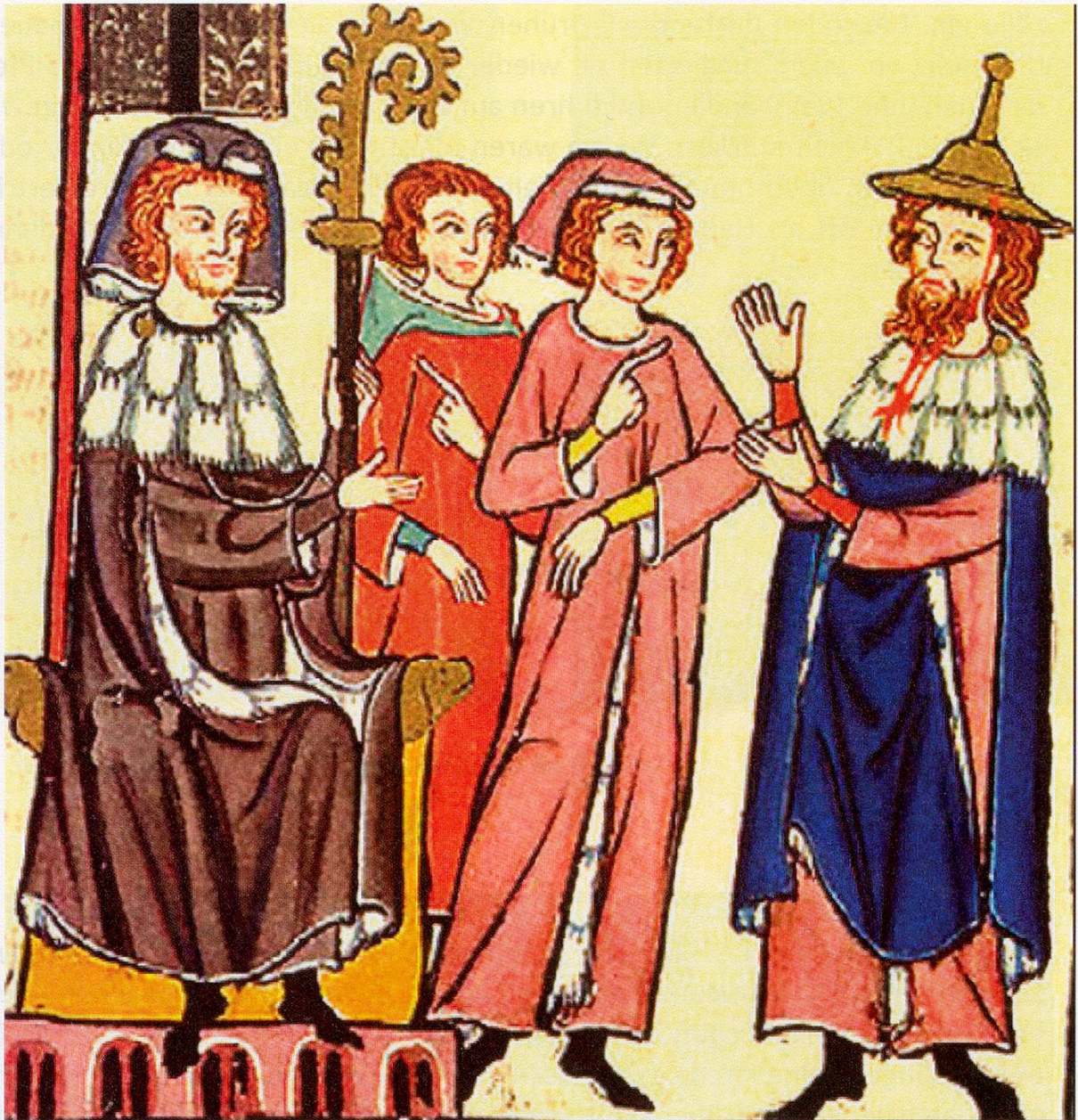
Jude mit Spitzhut: Minnesänger Süsskind von Trimberg (Manesse-Bilderhandschrift)