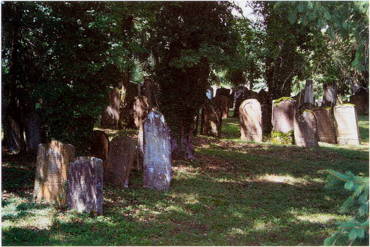
Jüdischer Friedhof in Emden