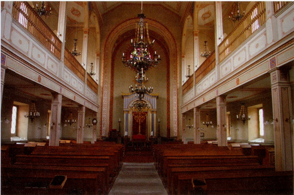
Synagoge von Lengnau