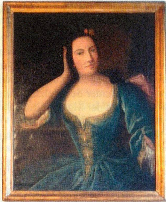
Jean-Philippe de Crousaz