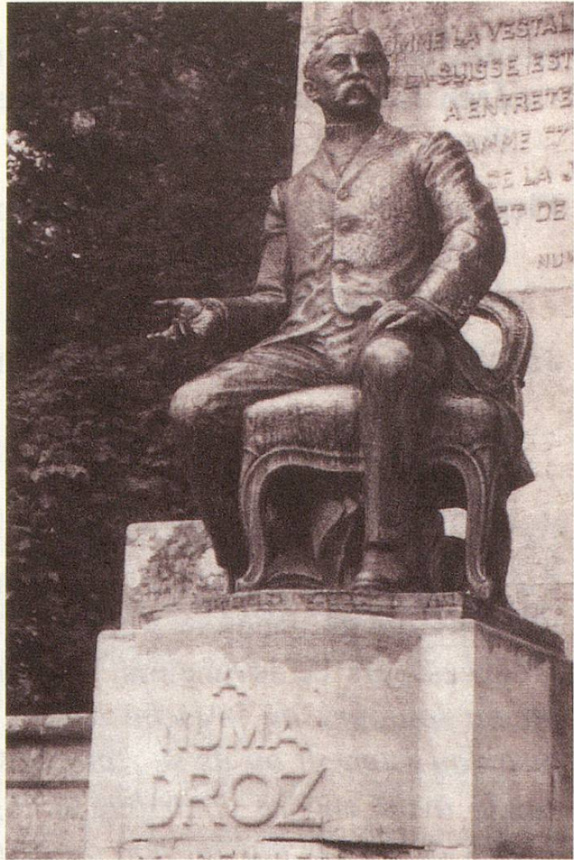
Fig. 4 Monument Numa Droz, Conseiller Fédéral, à La Chaux-de-Fonds Courrier du Val-de-Travers hebdomadaire, année 2004