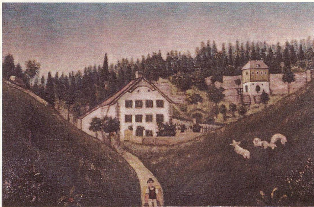
Fig. 2 La Combe Grieurin, à La Chaux-de-Fonds, maison natale de Numa Droz

bleau: sa maison, son environnement, un de ses fils sur le chemin, quelques moutons dans le pré. Cette petite peinture naïve a été emportée en Amérique par son fils Jules Zélim.