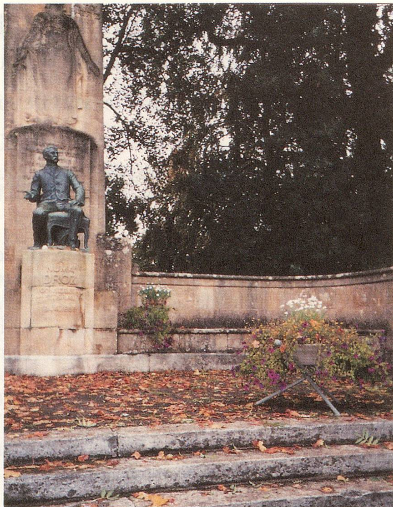
Fig. 1 Monument à La Chaux-de-Fonds

Jules Zélim Droz fils d'Eugène. Né le 28 octobre 1845 à la Combe Grieurin, maison du XVIII ème siècle sise en l'an 2000 au n° 3 du chemin de la Fusion à La Chaux-de-Fonds. Baptisé au Grand Temple le 22 novembre suivant; parrain: Zélim Droz son oncle. Marraine: Rosine Benguerel-dit-Perroud sa tante. Comme Numa, à 14 ans, il fait un apprentissage de graveur de boîtes de montres. Marié, il s'installe avec femme et enfants à la Combe Grieurin. Jules fait la connaissance d'un banquier qui lui fait miroiter un avenir opulent s'il se lance avec lui dans des transactions bancaires aux bénéfices importants. Après l'affaire conclue la réalité, pour Zélim, fut tout autre, car pour indemniser ses créanciers, Jules du se résoudre, avec un immense chagrin, à vendre la maison de famille de la Combe Grieurin où avaient vécu plusieurs générations de ses ancêtres. Cette banqueroute lui avait fait perdre tout son avoir, mais il quitta la Suisse la tête haute en ayant pu liquider toutes ses dettes grâce, aussi, à l'aide de son frère Numa. Ce dernier facilita le départ de son frère, de sa belle-soeur et des enfants pour les Etats-