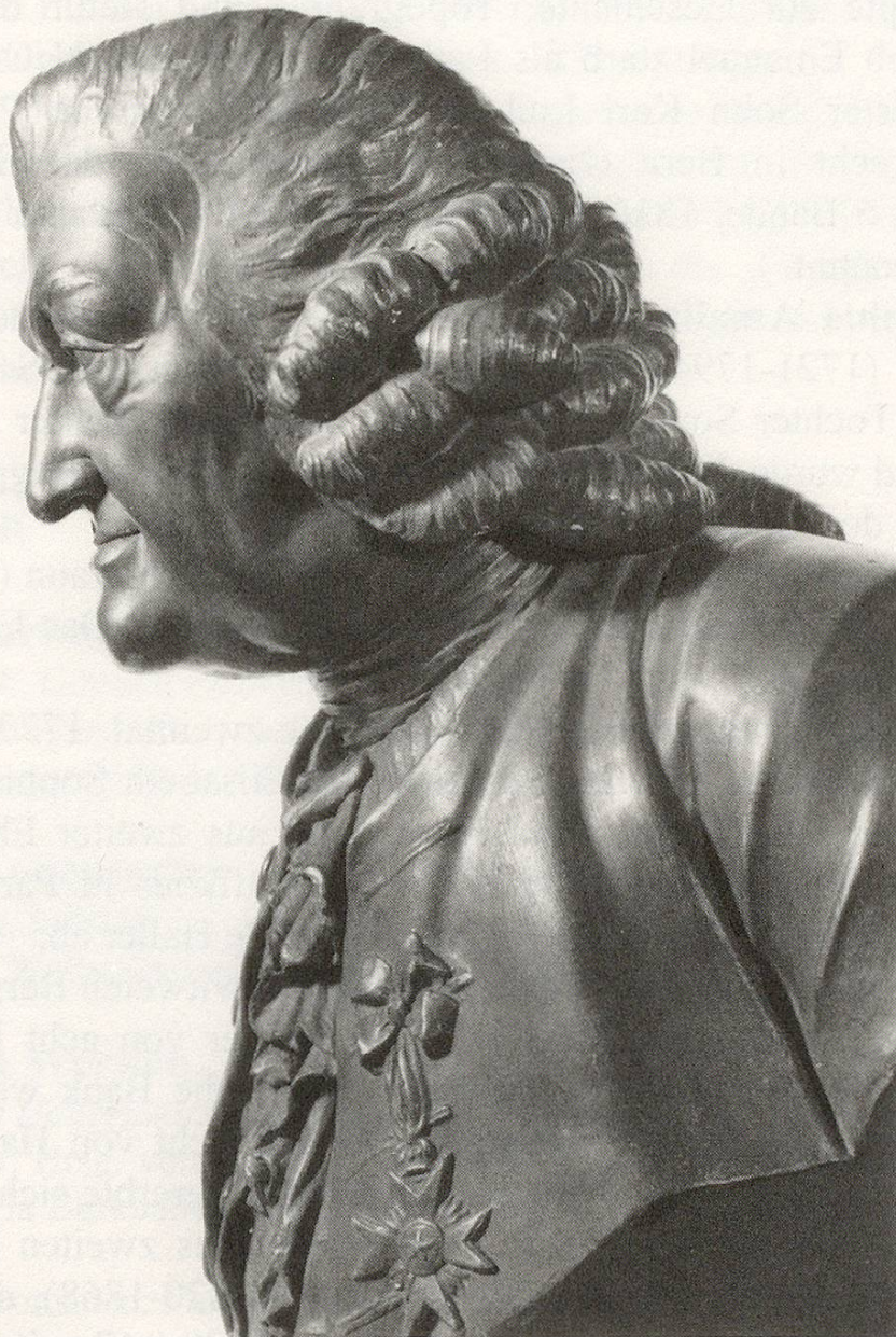
Abb. 3 Haller-Büste von 1775, ausgeführt von Johann Friedrich Funk. Bronziertes Gipsmodell in der Burgerbibliothek Bern

Von diesen elf Kindern haben sieben geheiratet.