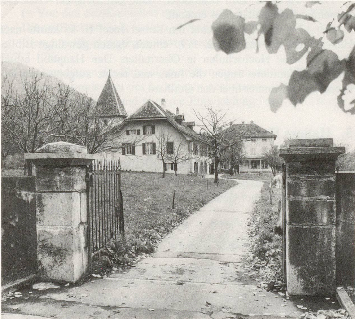
Abb. 2 Salzdirektor in Roche. Links das ehemalige Sudhaus mit Dampfzugsturm, rechts Hallers Wohnhaus. Foto von Gerhard Howald 1976