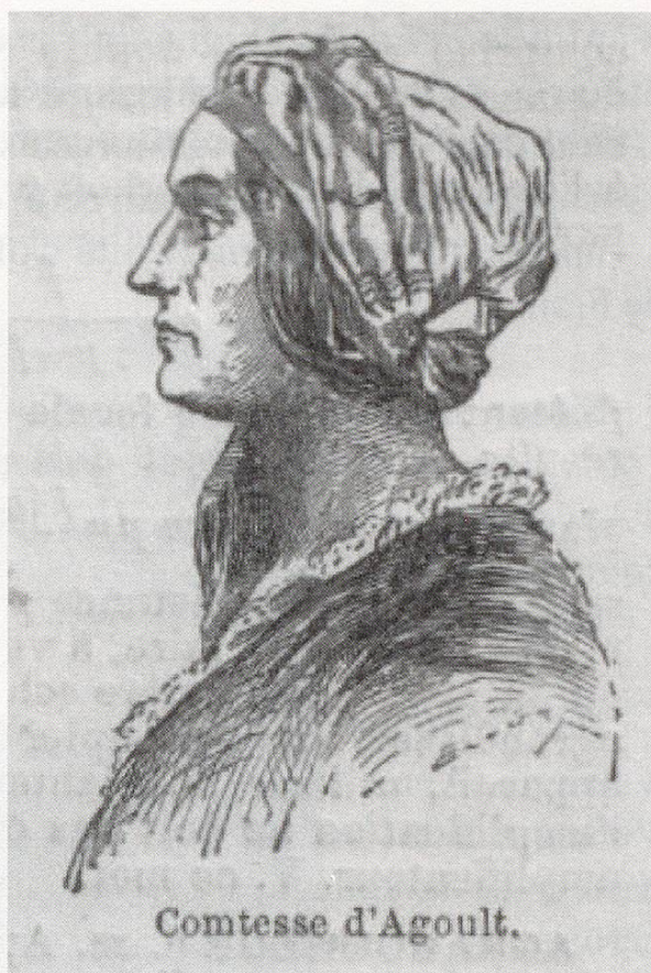
Fig. 1: Comtesse d'Agoult