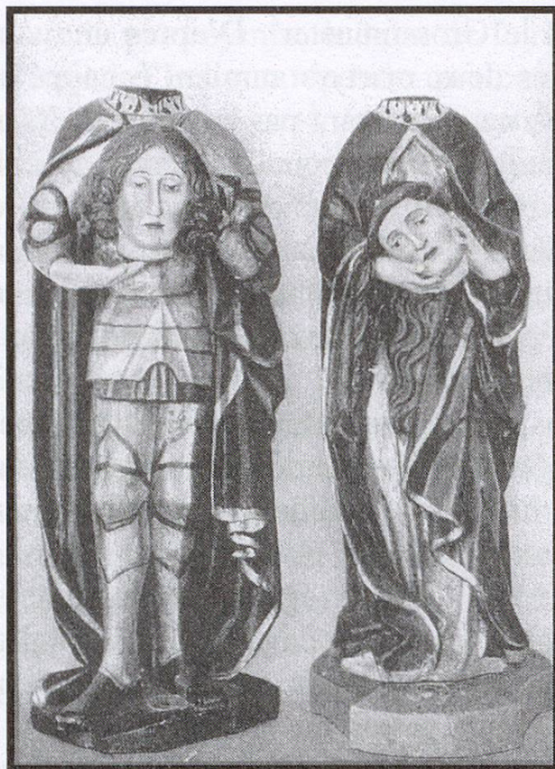
Fig. 1. Saint Felix et sa sœur Sainte Regula; église de Breil, vers 1500.

Dans son travail sur les noms grisons 11 , Huber cite les diverses formes onomastiques dérivées de Felix. Les multiples variantes de ce nom résultent des particularismes culturels et linguistiques propres à chaque région des Grisons 12 : Felix, Foelix, Feligs, Felis, Flis, Fleys, Felice (de), Felici(en), (de) Felicis, Felicio, (de) Felizio, Filizzo, F(e)lisch, Flÿsch, Fliisch (Flÿsch 13 ), Fleisch, Flaisch, (von) Caffli(e)sch, (de) Caflysch, de Kaflisch, Dagaflisch, Degaflisch. La figure 2 résume les modifications linguistiques et régionales des divers noms dérivant de Felix.