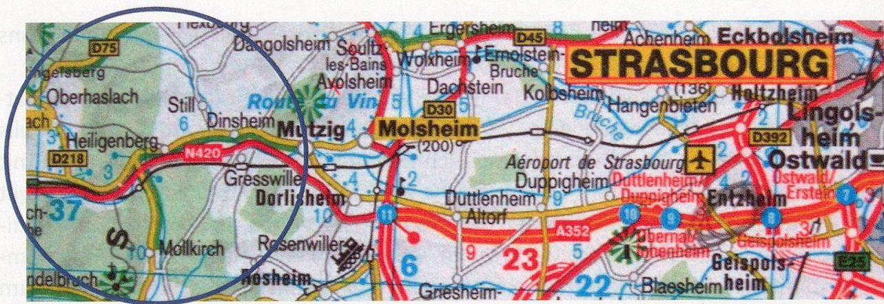
Abb. 4: Karte der Region Strasbourg, 1:300'000 (33236 red)