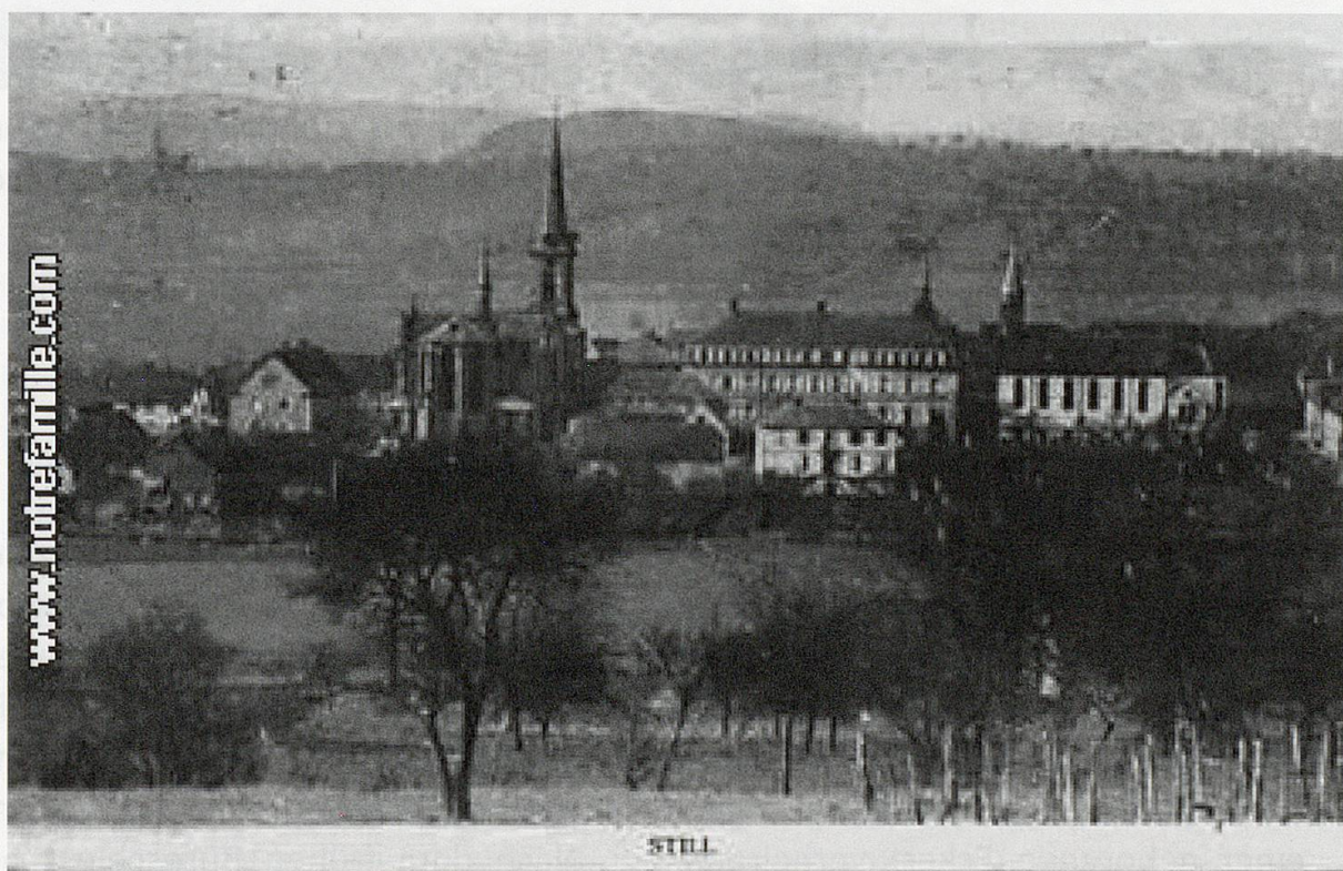
Abb. 2: Still um 1900

Nach dem schnellen Erfolg im Herbst 2001 in Strasbourg kommt die Neugierde und die zusätzliche Frage nach weiteren, uns aber unbekannten Verwandten auf. Auf Grund des 1984 erhaltenen Stammbaums meine ich, dass die Mairie in Mutzig für die Commune Still die jüngsten Unterlagen dafür haben muss. Auf den erhaltenen Termin vor Weihnachten 2001 hin, treffe ich an einem frühen Mittwochmorgen eines kalten Dezembertages im weihnachtlich geschmückten und beleuchteten Elsass ein und melde mich in der Mairie von Mutzig. Nach einem freundlichen Empfang werde ich in das Ablagesystem der Zivilregister eingeweiht und erhalte im grossen Salle de Mariage meinen Arbeitsplatz, einerseits sehr grosszügig aber andererseits doch etwas kalt. Doch meine eigentlich bekannten Vorfahren lassen und lassen sich nicht finden. Nach einer diesbezüglichen Rücksprache mit dem Sekretariat ist der Grund bald gefunden, ich bin wegen meiner Verwechslung in der falschen Mairie gelandet. Die falsche und die zutreffende Mairie weisen die gleiche Postleitzahl auf und in meinem Fall wäre Still und nicht Mutzig zuständig. Eigentlich erstaunlich und zugleich überraschend, wie man ohne irgendwelche Voranmeldung und Identifikation in einer Mairie zu einer Akteneinsicht in frühere Zivilstandsregistern kommt.