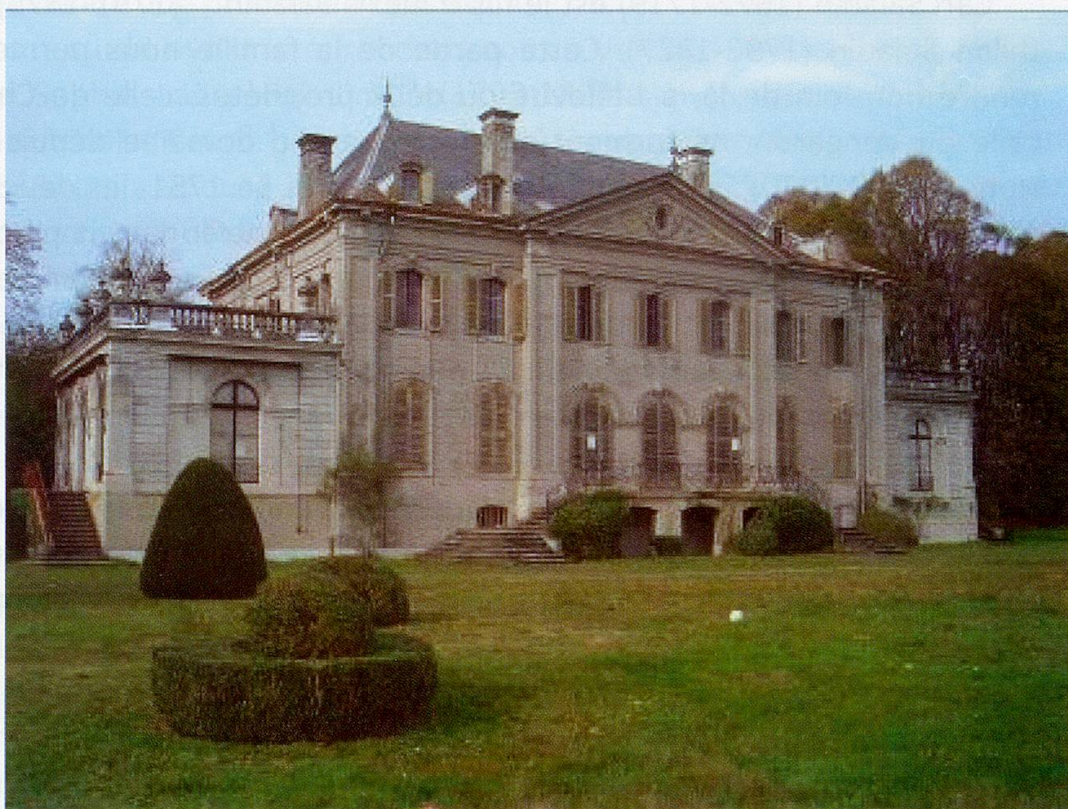
Le Grand Malagny à Genthod